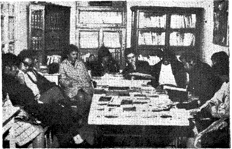
CLUB DEL LIBRO LEIDO.— Un rincón espiritual en el que se han refugiado estudiantes y libros para salvarse de la vorágine que está devorando al hombre