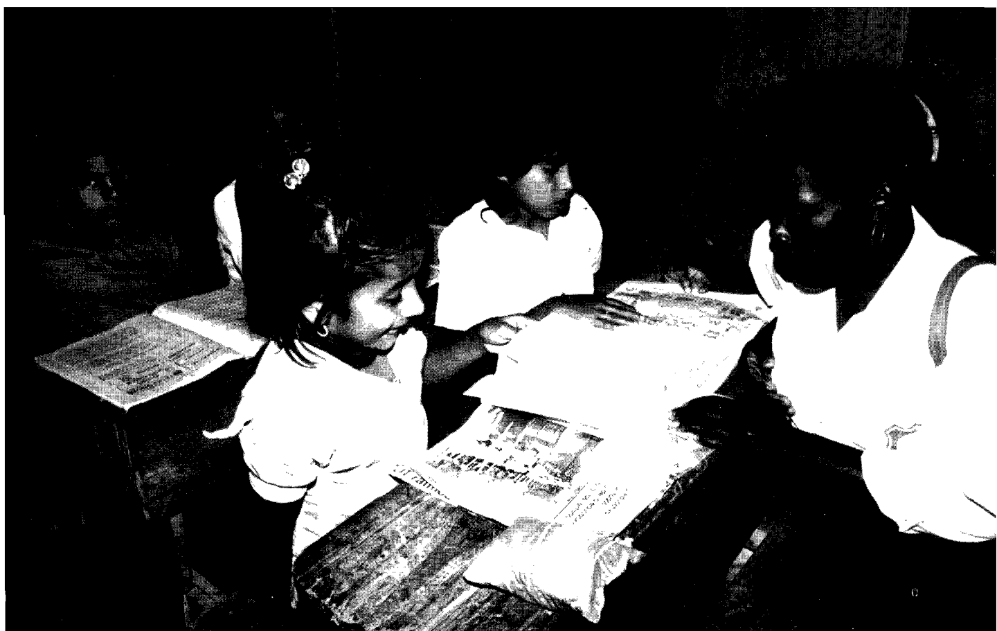
Es necesario cambiar el carácter instrumental de la comunicación para refundar las relaciones entre comunicación y educación

“El número de pobres aumenta en la región a razón de dos personas por minuto con ingresos menores a los dos dólares diarios; cerca de 200 millones de latinoamericanos (46% de la población total) no satisface sus necesidades básicas; 94 millones (22%) se encuentra en una situación de extrema pobreza; y 60 millones (18%) viven en situación de hambre crónica”.