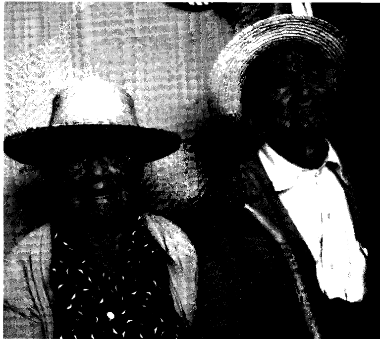
En el nuevo milenio las organizaciones de comunicación deberán ubicar el proyecto social por encima del interés académico o mercantil

La comunicación instrumentalizada a las acciones de cambio sufre reduccionismos didactistas en los procesos educativos; reduccionismos tecnologistas en la concepción y manejo de los medios; reduc-