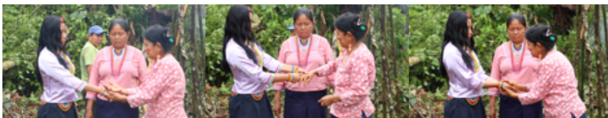
Figura 3.1. Transmisión de pajuyuk en la chagra, don para sembrar yuca

Las parteras para adquirir los dones tienen interacciones corporales con sabios o familiares que poseen algún don para sanar, aunque también existen otros dones que son para sembrar. Para que estos sabios les otorguen sus dones, ellas deben de pedirlos con mucho respeto y con la certitud que los cuidarán. Además, en algunas ocasiones se da una retribución por recibir el don, actualmente es un aporte económico, pero antes se daba a cambio un regalo: pueden ser una gallina, carne del monte, o algún alimento que le podría servir al sabio. Esto es una forma de demostrar el valor que tiene ese saber.