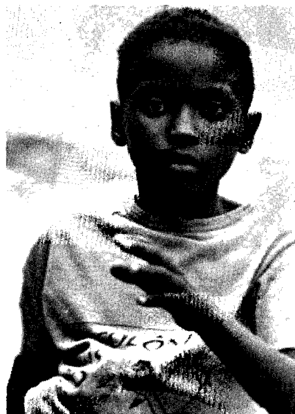
Niños de São Paulo

Después de María da Conceição fuimos a trabajar a otra favela de mejores ingresos e infraestructura con un grupo de niños vendedores de periódicos y revistas. Acumulamos experiencia. Iniciamos el trabajo con un tercer grupo a principios de 1993 en una de las favelas más pobres y violentas de la región. Los resultados despertaron interés en replicar y profundizar el trabajo en otras ciudades. Nuestra metodología no está cerrada. Se reconstruye permanentemente. Con cada experiencia agregamos nuevos elementos dejando siempre espacio para la creatividad de los niños, dentro o fuera del marco propuesto. Así lo exigen ellos. Nuestro aprendizaje y nuestra actividad no cesan. ●