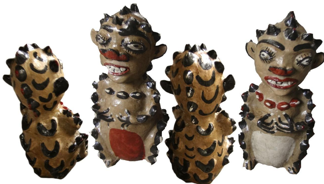
Imagen 2. Subjetividades del bosque.

mujer, la esencia de la mujer hace parte de todo el proceso de elaboración. De esta manera, mezclar la chicha que elabora una mujer en la tinaja de otra es homogenizarla ignorando la relación particular y personificada que existe entre la yuca que se siembra, la vasija que se moldea, la chicha que se hace y la mucahua que finalmente vierte la sabiduría de la mujer en la persona que bebe de ella.