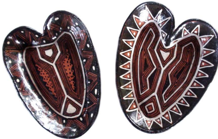
Imagen 1. Cerámica kichwa .

La cerámica, entendida como práctica artística, en el mejor de los casos, o como artesanía en el caso más común, puede ser calificada como un objeto sobresaliente, delicado, con hermosos diseños dibujados en su superficie (imagen 1). Esta puede ser presentada como una búsqueda de espiritualidad de culturas indígenas remotas y en muchos casos ya inexistentes. De igual manera pueden ser objetos admirables por haber sido desarrollados en lugares recónditos donde aún la gente no tiene electricidad y no trabaja con tornos y con hornos a gas. En este sentido, evidencia un tipo de perspectiva desde la cual se asume, qué es esta cerámica y cómo debemos verla.