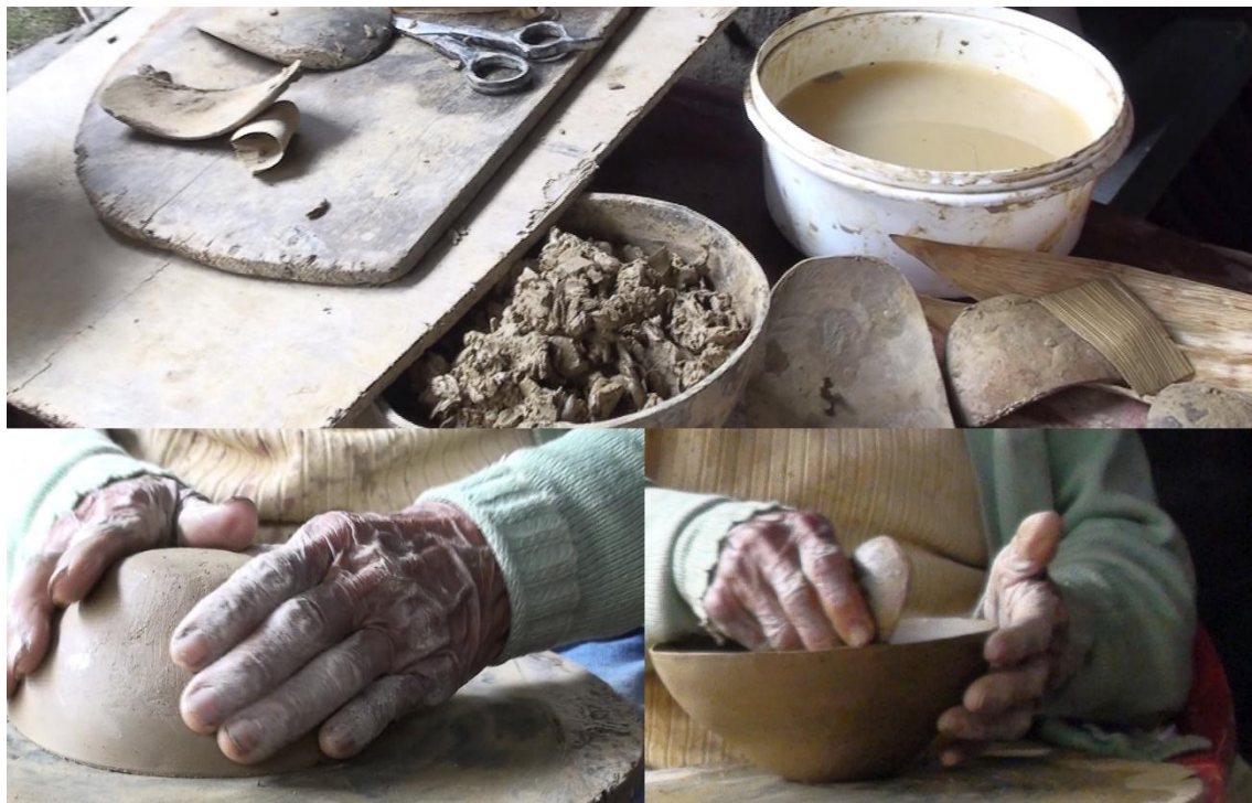
Imagen 3. Tejiendo mucahuas .

El barro es quizás el material más importante en la elaboración cerámica, ya que es el que más sabiduría y acompañamiento le brinda a la ceramista. Otros materiales también son de vital importancia: el agua, el fuego, la tabla que sostiene la cerámica, las achuelas y muchos elementos más. En la imagen 3 se puede observar cómo la cerámica es pacientemente formada utilizando varios instrumentos y materiales para este fin.