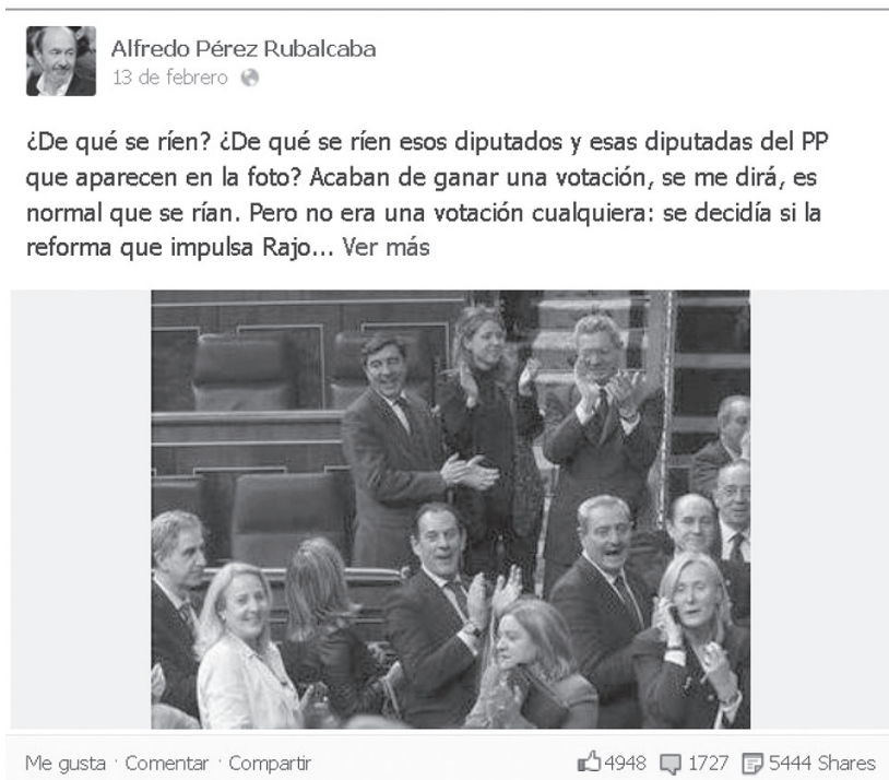
Imagen 1: Detalle del mensaje que generó más interactividad

Por último, cabe señalar que el mensaje que generó una mayor interactividad fue uno publicado por Alfredo Pérez Rubalcaba (PSOE) el 13 de febrero (Imagen 1), y que generó 4.948 “me gusta”, 1.727 comentarios y fue compartido en 5.444 ocasiones.