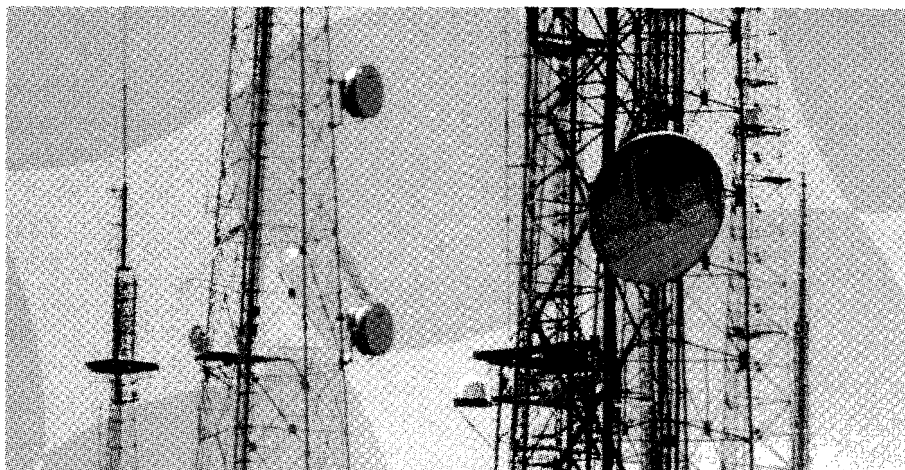
Bosque radiofónico de antenas