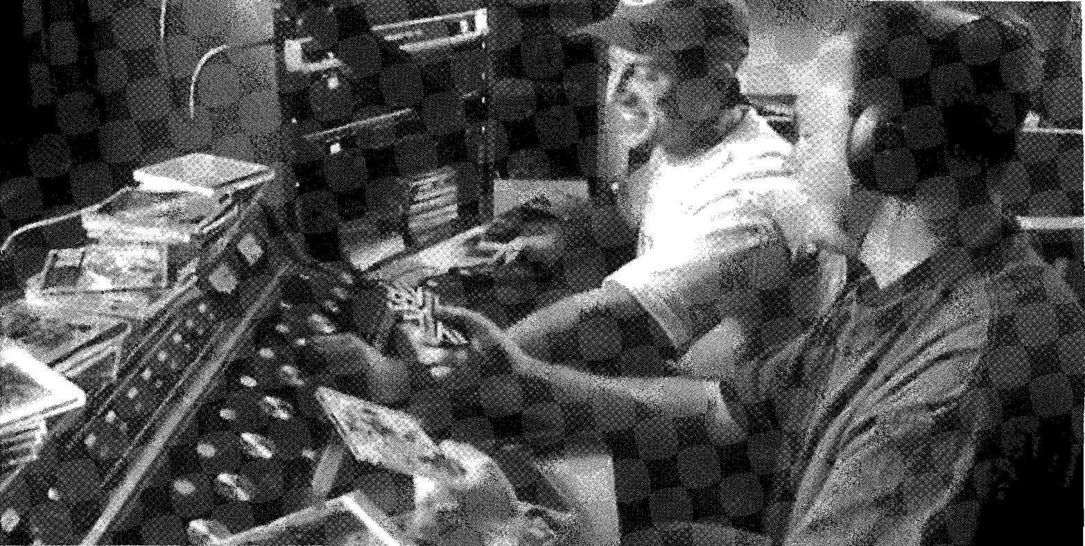
La consola radiofónica

últimos años, o bien han intentado arrebatarlas - ofreciéndoles importantes sumas de dinero- o bien han recurrido a figuras de la televisión.