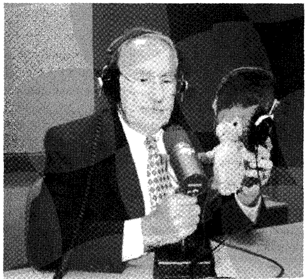
El hombre de la radio entra a todos los hogares

Las cadenas, públicas y privadas, dan una enorme importancia a este género, muy probablemente por el prestigio del que impregna la parrilla dado su alto valor social. Pero también se debe considerar el haber sabido acoplar su emisión a los hábitos sociales, especialmente durante los días laborables. La información forma parte de todas las parrillas entre las 06h00 y las 10h00. Es la franja denominada drive time , en la que destacan la actualidad y los servicios (tráfico y meteorología). Con el paso del tiempo, estos espacios se han ido incorporando como parte del magazine matinal, una de las causas de la hibridación de la información y el entretenimiento. Por la noche, aunque con menor audiencia por la competencia de la televisión,