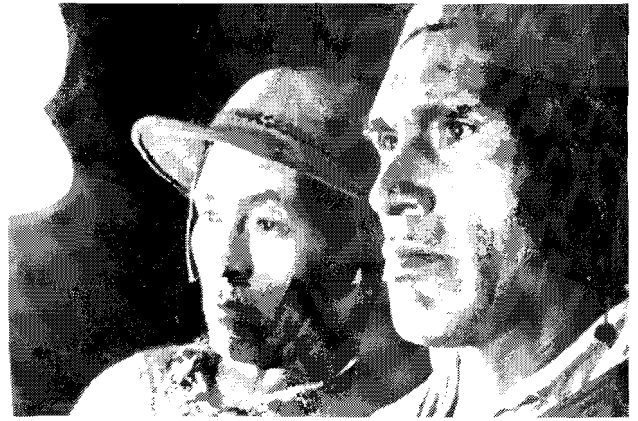
Rostros indígenas en escena

Sin embargo, los medios también pueden contribuir a la resistencia cultural, como reflejan centenas de profesionales indígenas que trabajan a diario en la radio y, en menor medida, en la televisión. El cine indígena puede consolidar la resistencia y ayudar a la normalización cultural y lingüística. Aún más, se puede permitir el lujo de hacerlo con una normalidad subversiva. ☉