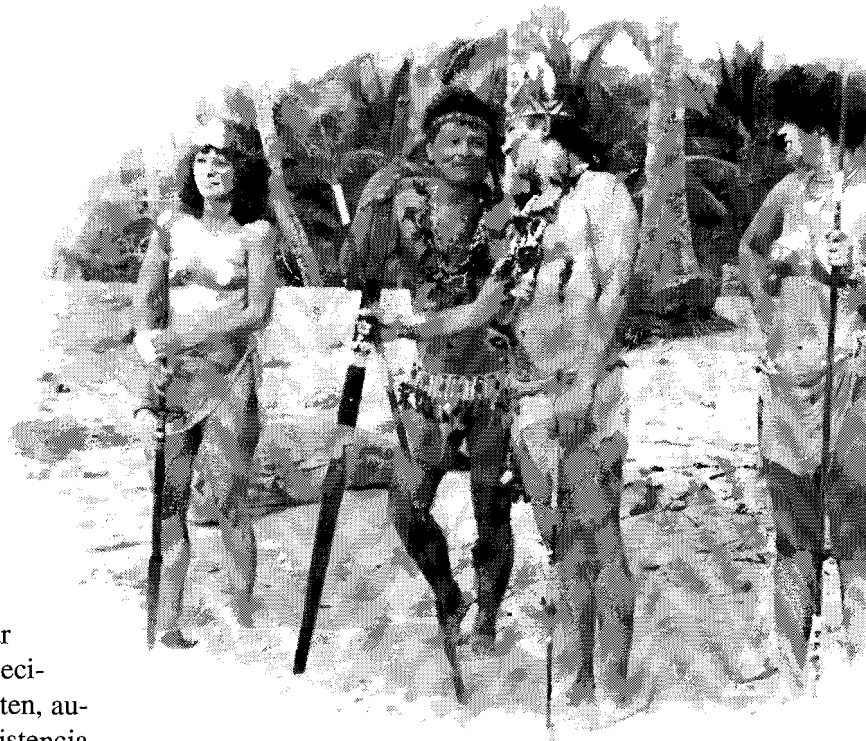
Artistas seudo indígenas en filmación

Por ejemplo, una radio que difunde consejos de salud en una lengua indígena puede ser vista por el Estado como el único medio para llegar a las poblaciones monolingües que desconocen el castellano o el portugués. En ese caso, la lengua indígena es el único instrumento disponible para que el Estado transmita su mensaje. A veces, la comunicación en una lengua indígena es incluso vista por el Estado como un mal menor, una concesión a la diversidad por motivos económicos o sociales, a pesar de que el objetivo final continúe siendo la unificación cultural.