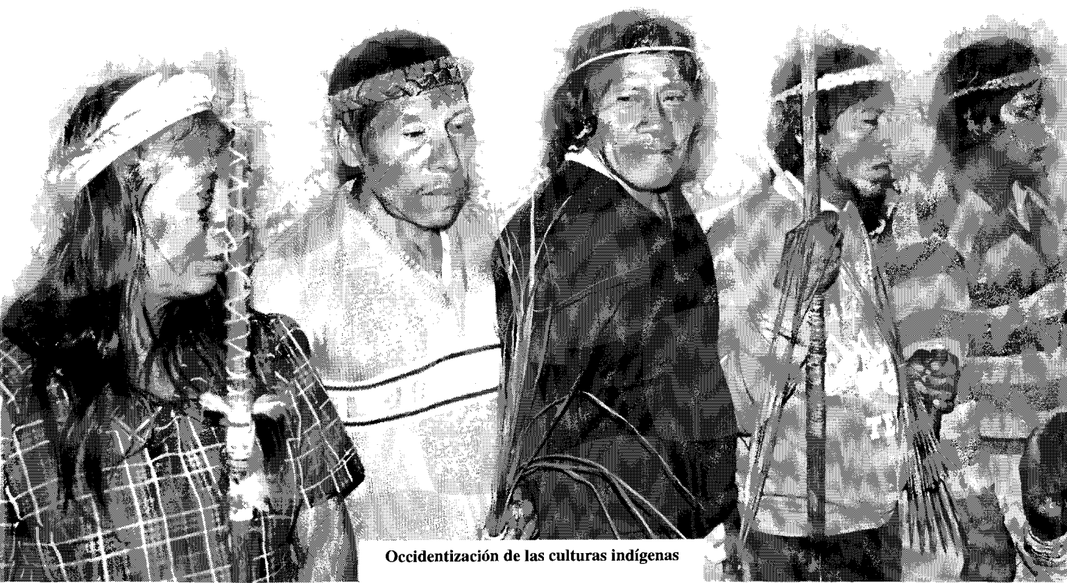
Occidentización de las culturas indígenas

Por esto, la sobrevivencia de una lengua amenazada requiere presencia en los medios de comunicación. Cualquier intento de liberación indígena irá acompañada de una recuperación del uso y la dignidad social de las lenguas minorizadas. Un pueblo difícilmente puede recuperarse de siglos de historia adversa si usa la lengua de quienes lo han conquistado. Usar esa lengua es adoptar también una manera ajena de ver el mundo, en ocasiones incluso hostil. En este sentido, el pleno uso de una lengua indígena es más que un aporte a la diversidad cultural latinoamericana. Es un medio indispensable para el pleno desarrollo de los pueblos.