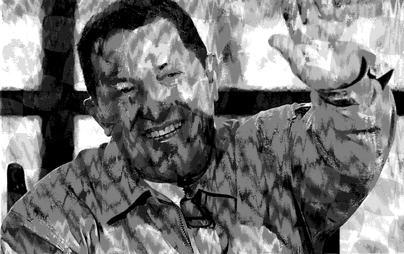
Chávez sigue y la tormenta también

El gobierno ha dejado en claro que este instrumento se aprobará y para ello hará valer su bancada legislativa