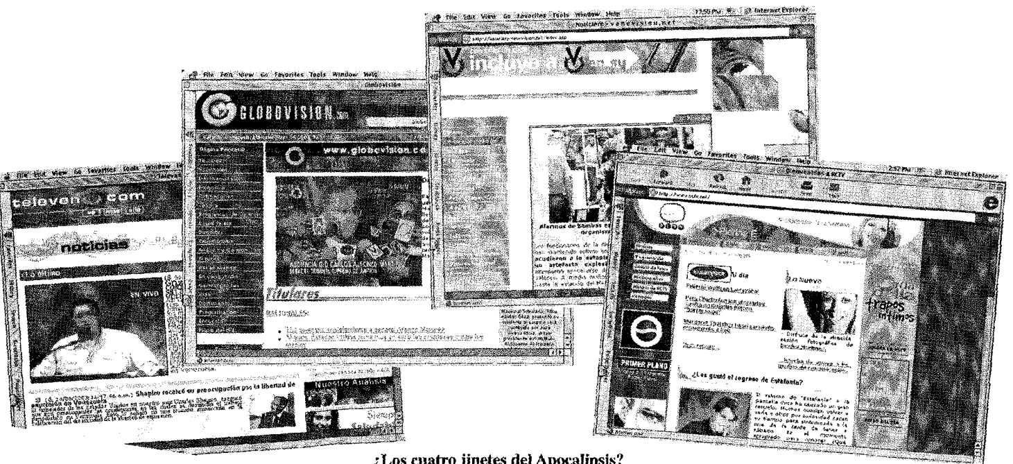
¿Los cuatro jinetes del Apocalipsis?