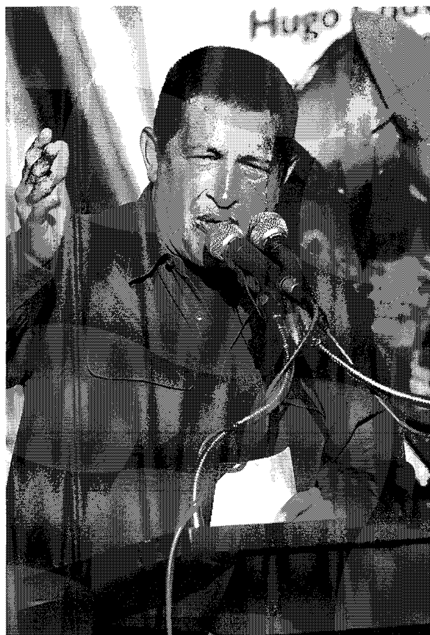
Chávez desde el escenario

Expertos como Antonio Pasquali, tradicionalmente críticos de los medios privados, creen que es inconveniente “en este momento político” aprobar un instrumento como el que propone el gobierno. El presidente