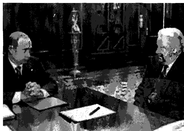
Putin y Yeltsin, su antecesor

La p6rdida del Izvestia ser6 la segunda gran p6rdida medial en un a6o. En mayo 2002 el diario liberal Obshchaya Gazeta cerr6 diez a6os de trabajo y fue puesto en venta. En 2001 el gigante gasero Gazprom, puesto por el Kremlin para volver asunto econ6mico lo pol6tico, cerr6 la mayoría del imperio medial de Vladimir Gusinsky, incluido el diario Segodnya.