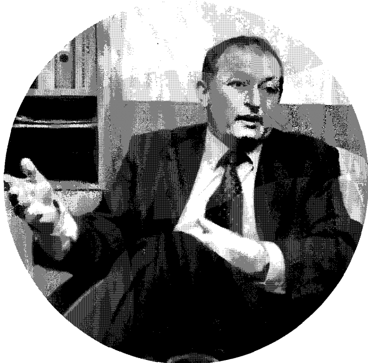
El checo Vladimir Votápek

Es que el Nuevo Izvestia se permitió mucho en contra del Kremlin; en el otoño 2002 puso un título "Todos somos rehenes del Kremlin" (octubre 29); cuando se hundió el submarino nuclear Kursk publicó: "Nueve días de vergüenza nacional".