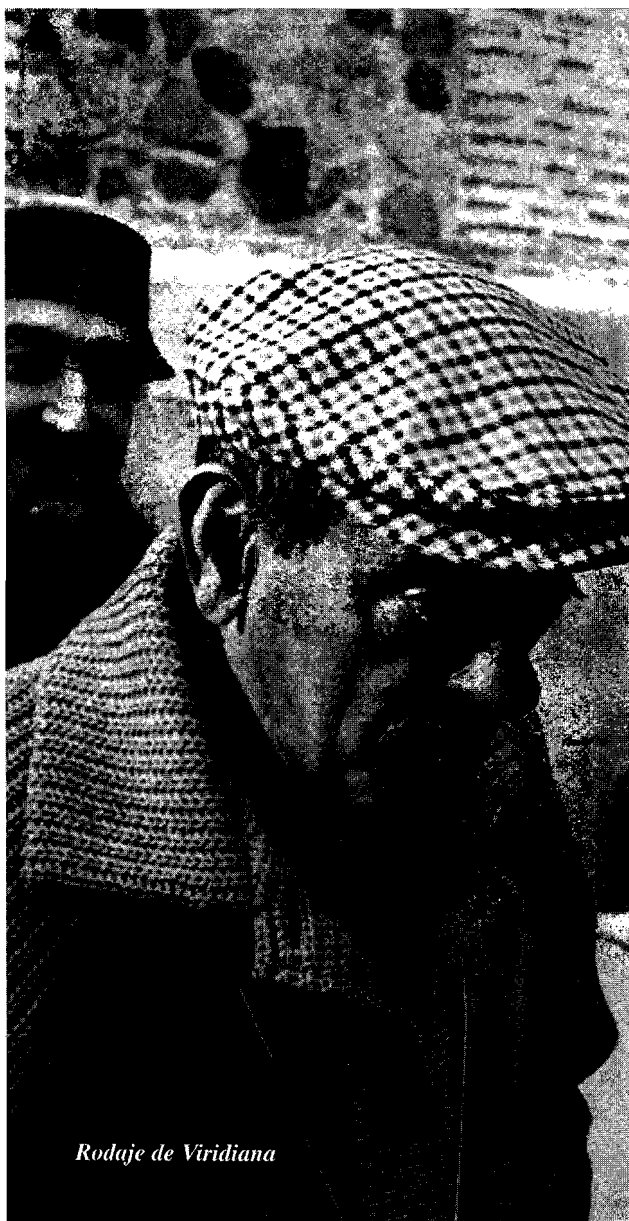
Rodaje de Viridiana

tambores que en Calanda (el pueblo donde nació) conmemoraban las tinieblas que se extendieron sobre la tierra en el instante de la muerte de Cristo. Esa ceremonia colectiva quedó fija en su memoria y tuvo cauce en varias películas en las que puso una banda sonora de los tambores como un obsesivo mensaje para todo el género humano, que debe sondear en su memoria los sonidos secretos de una vida interior, de una trama soñada. En "Nazarín" (1958) logra imágenes conmovedoras cuando al final el redoble de Calanda acompaña al cura solitario que ha perdido toda confianza en los valores de la religión y la moral.