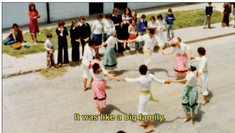
Fotograma de La Siberia : archivo de una celebración en La Siberia. 16

En una primera aproximación, se evidenció que hay varios elementos del documental que están expuestos a la “paradoja del inmemorial”. Por medio del uso de video y fotografía de archivo de antiguos habitantes, el documental apuesta a ser un puente que explora la memoria colectiva de este pueblo. Sin embargo, en la medida en que los eventos narrados y el uso de los archivos fotográficos privados de antiguos habitantes están soportados por una narrativa de un tono elegíaco, el uso de la narración y del archivo fotográfico es preponderantemente icónico. En efecto, apenas hay un par de vínculos indiciales entre eventos fácticos específicos y la narración o las imágenes de archivo mencionadas. En consecuencia, se podría estar invocando el inmemorial, según se argumentó antes.