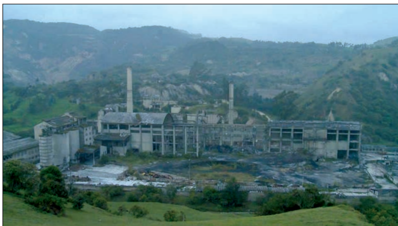
Fotograma de La Siberia : las ruinas al amanecer.

operación en 1934 con el fin de surtir cemento para la acelerada expansión urbana de la capital colombiana a mediados del siglo XX. Como mano de obra principal, incorporó a los habitantes del municipio, cuya población era preponderantemente rural. La Siberia conjugaba una urbanización del mismo nombre, donde vivían muchas familias de los antiguos trabajadores, incluyendo en sus instalaciones una escuela y un centro cultural. Por todo lo anterior, se constituyó en el eje de las actividades económicas de La Calera, así como de sus actividades culturales. Cerrada en 1998, entre otras, por causa de la obsolescencia tecnológica, la escasez de materia prima y los cambios en la estructura del mercado del cemento, hoy en día La Siberia es una monumental y escalofriante ruina. Lentamente carcomida entre sus grietas por el verde del campo que la circunda, el cemento derretido de su estructura aún evoca en forma inexplicable a Chernobyl.