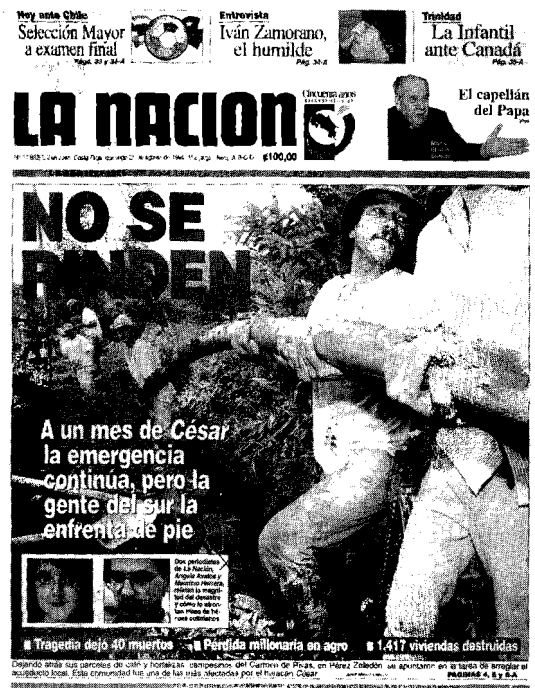
"Salvo las notas relativas al fútbol, esta primera página no contiene novedad alguna. Lo del Huracán César ocurrió 2 meses atrás". (25-VIII-96)

S i aceptamos que la prensa diaria debe responder al derecho humano de la información y contestar pronto la interrogante de David Livingstone: ¿qué pasa en el mundo?, a todos nos va a sorprender que un diario destine su primera plana, no a las noticias, sino a sus propias ficciones.