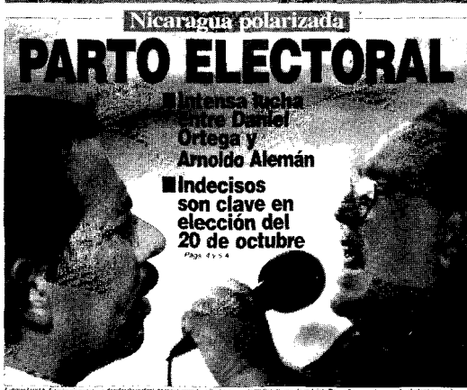
"La foto periodística de actualidad ya no viene de lo real, aquí salió de la computadora. Se trata de un montaje". (6-X-96)

invasión de una finca e incluso las declaraciones de un ex-presidente de la República. Todas del día anterior y contempladas en el mismo diario, páginas adentro.