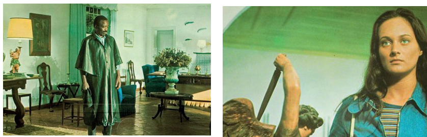
Figuras 8 e 9. Fotos de divulgação de O Anjo da Noite .