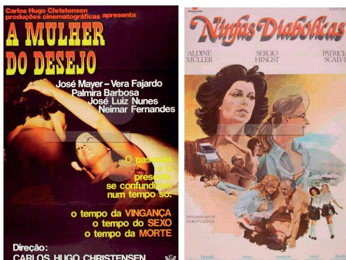
Figuras 14 e 15. Cartazes de A Mulher do Desejo (1975) e Ninfas Diabólicas (1977)