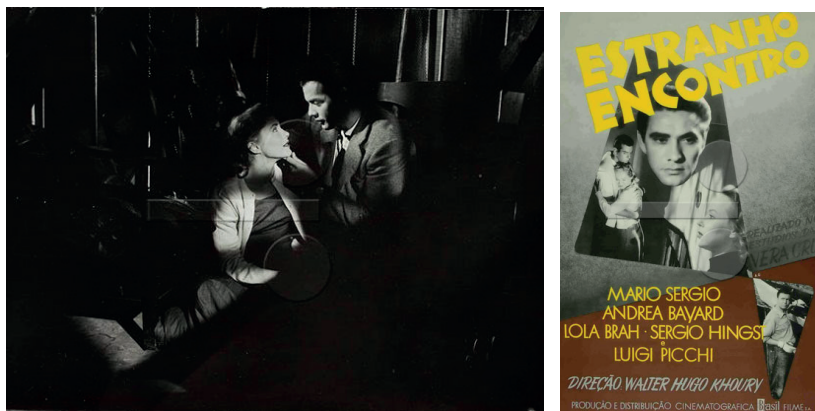
Figuras 3 e 4. Foto de divulgação de Estranho Encontro (1958); Cartaz do filme.