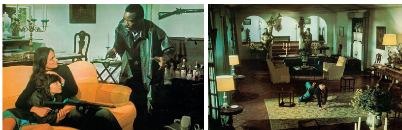
Figuras 12 e 13. Fotos de divulgação de O Anjo da Noite