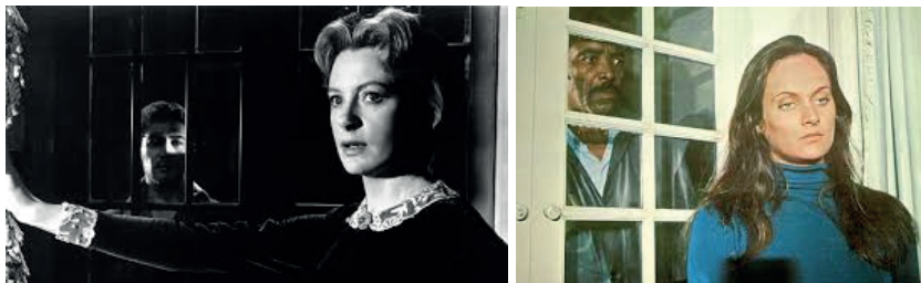
Figuras 6 e 7. Frame de The Innocents ; foto de divulgação de O Anjo da Noite .

de aproximar as duas obras. No primeiro caso (Figura 6), vemos a babá sendo assombrada pelo fantasma do capataz Quint (Peter Wyngarde). No segundo (Figura 7), temos a jovem Ana observada pelo segurança Augusto.