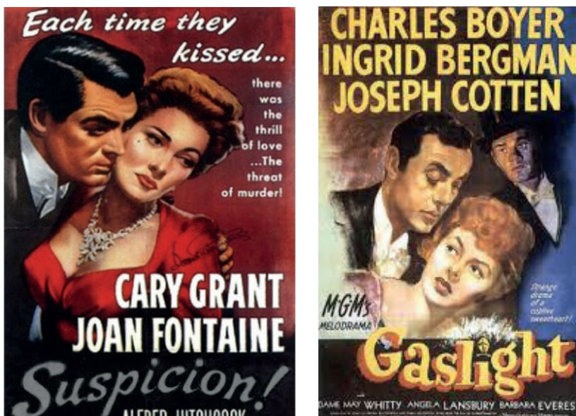
Figuras 1 e 2. Cartazes dos filmes Suspicion (1944) e Gaslight (1944).