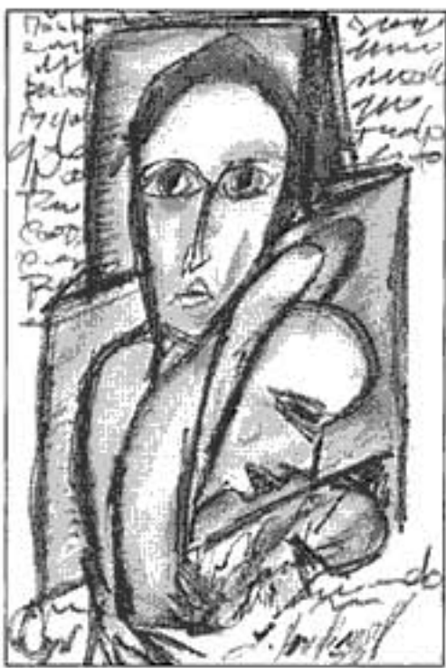
Portada: Jaime Landívar