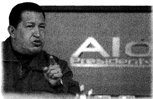
Presidente de Venezuela, Hugo Chávez en el programa Aló Presidente

El presidente de Venezuela, Hugo Chávez, inauguró el nuevo formato de su programa semanal Aló, Presidente , que dejará de ser el espacio dominical donde tomaba decisiones de gobierno en público para convertirse en la fuente diaria, de lunes a viernes, de primicias noticiosas y campañas ideológicas. El mandatario se propone además promover lo que llama "cinco motores" de la revolución: encabezada por una ley habilitante que le permite legislar por decreto, llamada "vía directa al socialismo".