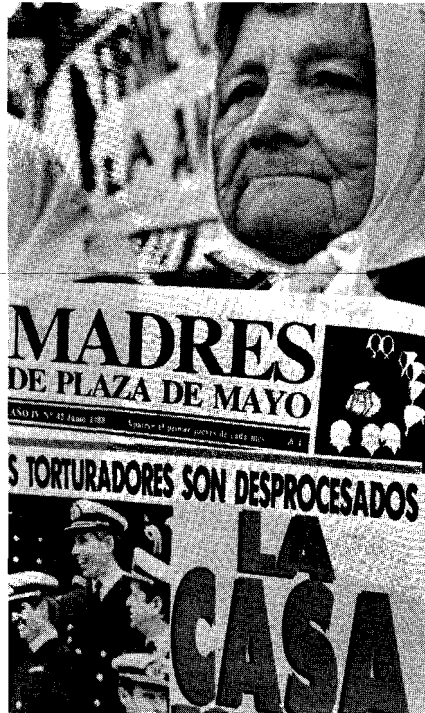
Las Madres de la Plaza de Mayo

Del 60 al 90 fueron décadas en las que no se pudo asumir un verdadero proyecto de prensa popular; los medios estuvieron atiborrados de "verdades", se priorizó siempre qué es lo que quería decir el partido, el movimiento, sin tener en cuenta a quién se dirigía y si realmente aportaba a un proceso de organización popular. En muy pocas oportunidades los periódicos denominados alternativos partieron de la realidad, de los intereses de la gente. Se llamaron participativos pero no procedieron así en los hechos. Se transformaron en monólogo impositivo, eligiendo los temas a tratar de acuerdo a los intereses del grupo y no del conjunto del pueblo. En unos casos se utilizó un lenguaje alejado, rebuscado y estereotipado, como un sistema de re-