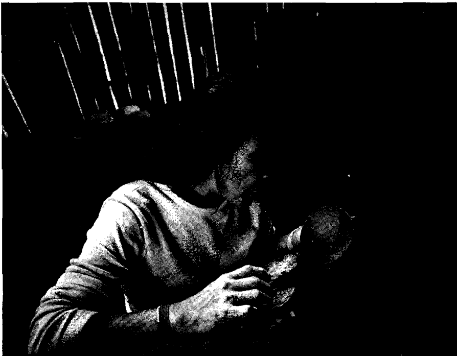
Indígena del Oriente Ecuatoriano