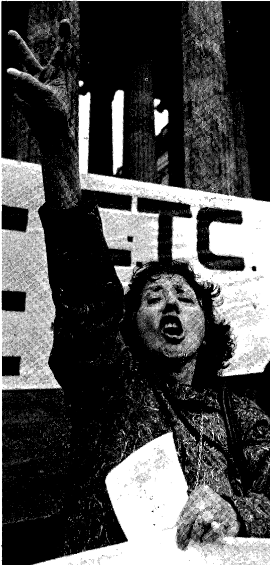
Roberto Schmidt, AFP Photo, Bogotá, 1991