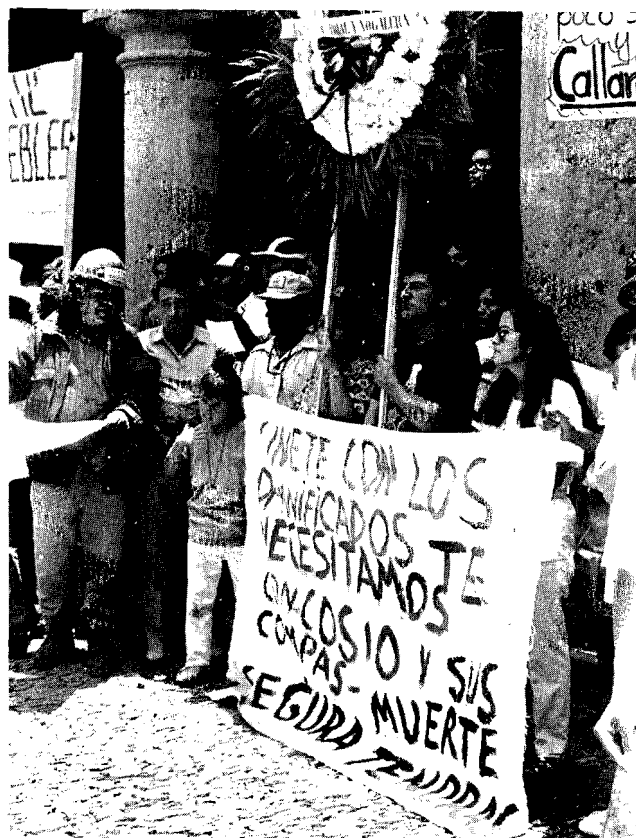
Un nuevo tipo de movilización ciudadana

Y los cuales se volcaron sobre los medios: cartas al editor, telefonazos en vivo, entrevistas sin cortes. Todo reflejaba un afán difuso de conectarse con algo. Reporteros, conductores, periodistas y analistas, estuvieron a la altura de las exigencias. El accionar colectivo generó una importante dinámica emancipadora. El atreverse a hablar surgió de impulsos colectivos y experiencias compartidas.