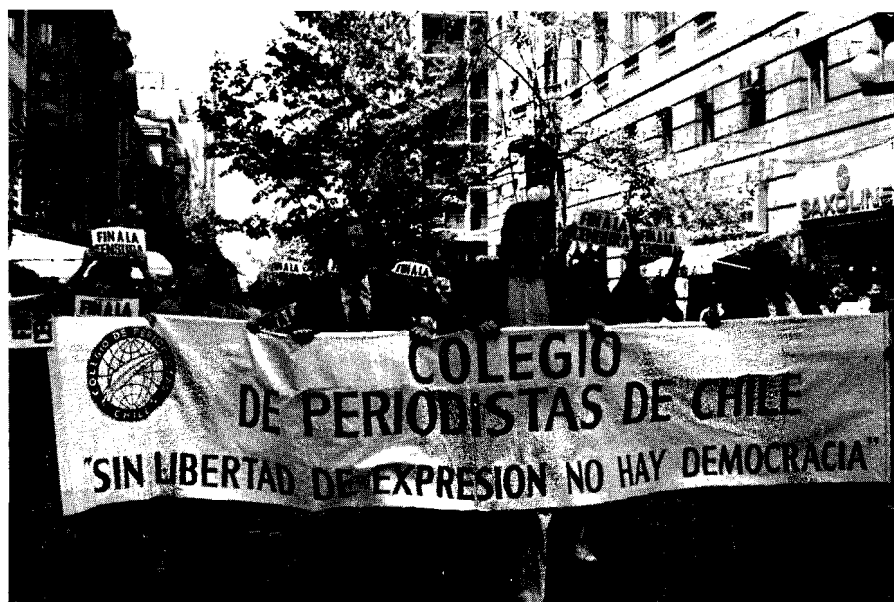
Manifestación de periodistas durante la dictadura