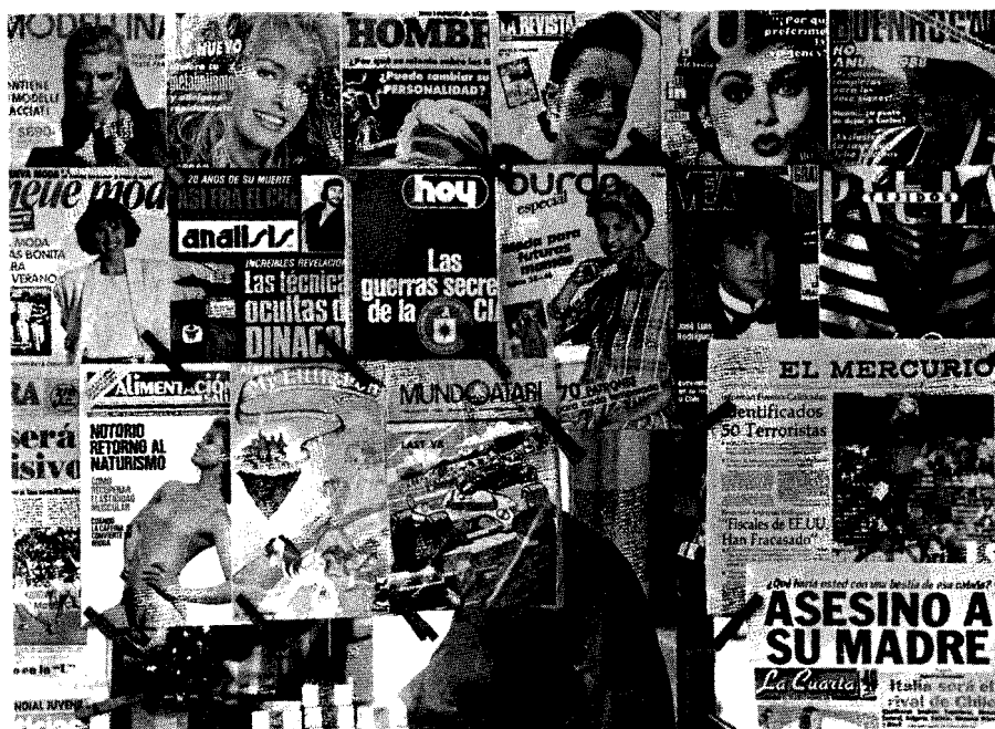
Variedades en un kiosco de Santiago

Transcurridos tres años del término de la dictadura del general Augusto Pinochet, el tema de la democratización de la prensa aún se debate entre empresarios y periodistas, y también entre los profesionales y el gobierno del Presidente Patricio Aylwin.