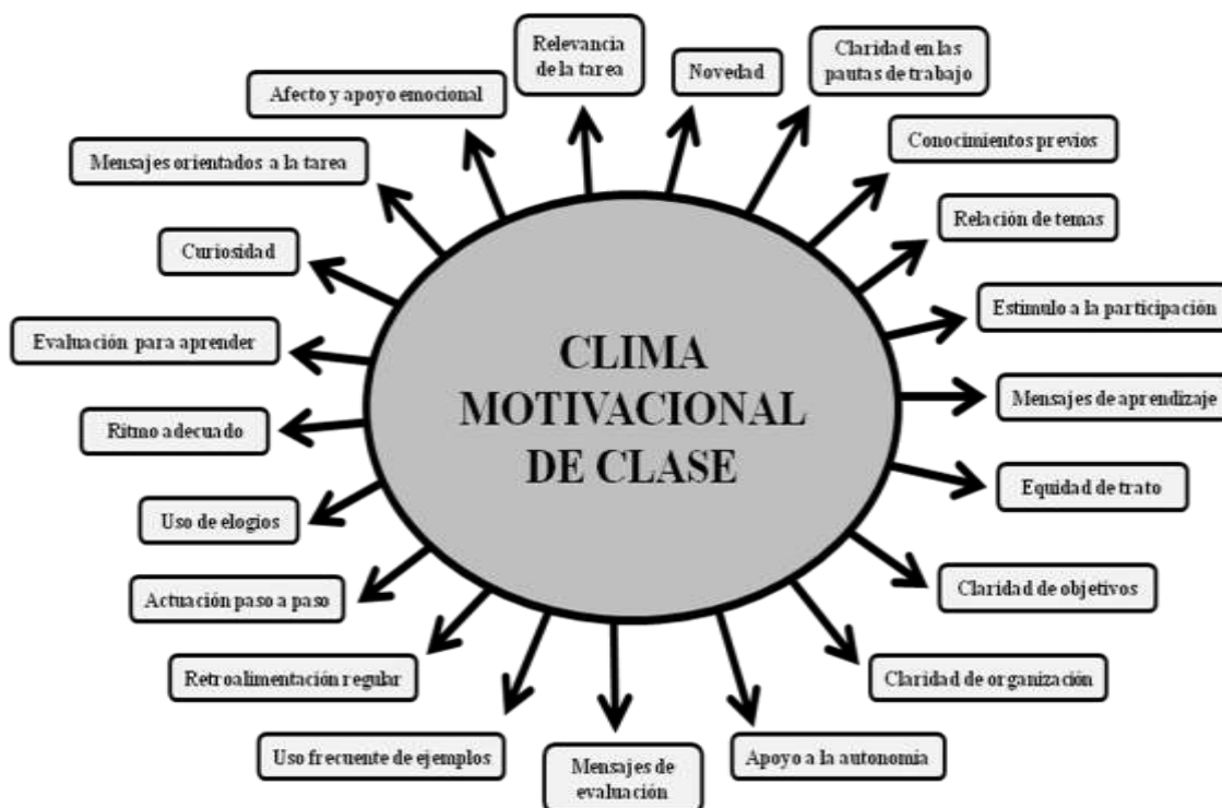
Esquema 2. Categorías del CMC de Alonso Tapia & Fernández (2008) y aportes de Eliff & Huertas (2014) utilizadas en análisis de relatos durante las sesiones 1 a 4.

se añadieron para el programa de intervención cinco (5) categorías: cambios sobre la marcha, relevancia de la tarea, mensajes orientados a la tarea, curiosidad y claridad en las pautas de trabajo (Eliff & Huertas, 2014).