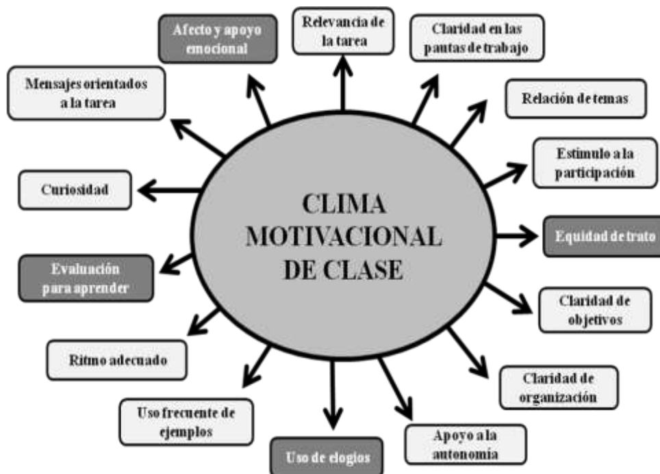
Esquema 3. Categorías del CMC elegidas por los docentes para formular metas de cambio.

propusieron generar cambios en la práctica de enseñanza. Las categorías del CMC expuestas en el esquema 3 fueron reconocidas por los docentes ya que eran fáciles de trabajar en el aula. De las quince (15) categorías, sólo cuatro (4) se corresponden con categorías reconocidas en esta investigación como emocionales, en tanto se estima que afectan a la calidad afectiva de las interacciones.