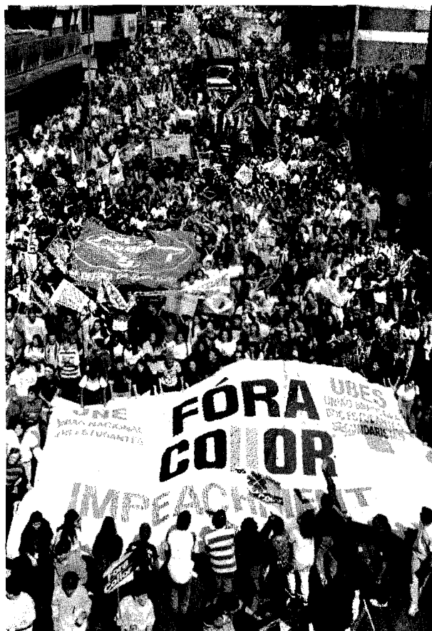
Jesus Carlos / Imagen Latina

A pesar del impacto inicial de las medidas económicas Collor mantuvo inicialmente la mayor parte del apoyo ciu-