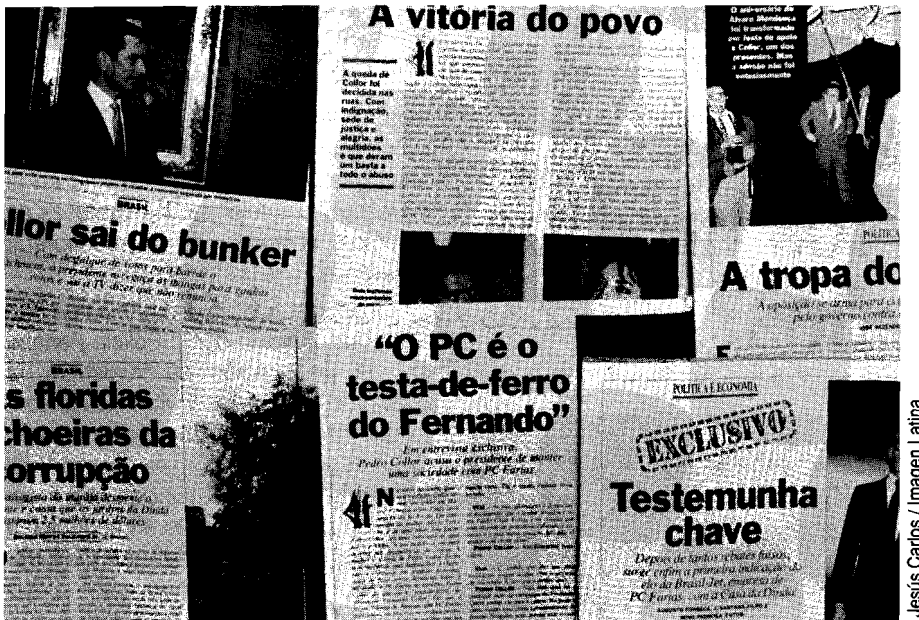
La prensa pasa a la oposición

dadano. Las críticas de la prensa fueron en el sentido de acelerar las privatizaciones. Las denuncias de corrupción en el gobierno en ningún momento implicaron la reducción del incentivo que significaba para los grandes medios los beneficios ligados a la desestatización.