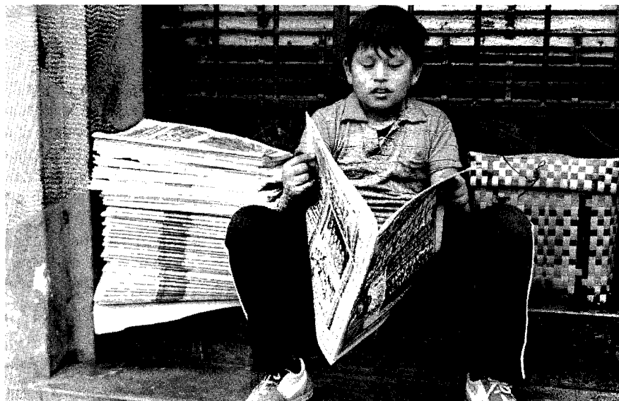
Niño vendedor de diarios

1. Perfil "ofrecido" del profesional. Se constata una tendencia a formar periodistas en las Escuelas Universitarias y comunicadores sociales en los nuevos Instituto Profesionales.