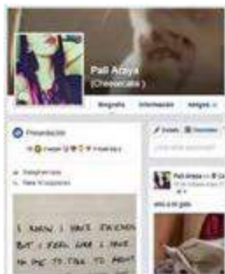
Imagen 1. Perfil ficticio para etnografía virtual, año 2016.

Para ser miembro de esta comunidad se utilizaron algunas tácticas de acceso al campo, observando de forma previa las prácticas de interacción y de autopresentación, identificando elementos comunes y características de sus miembros. Con esta información se construyó un perfil ficcionado (Imagen 1) que sirvió para ingresar a la comunidad. A este perfil se le asignó un nombre, fecha de nacimiento, una foto de perfil, una foto de portada y suscripciones a distintas páginas de Facebook. Dicho perfil correspondía al de una joven de 20 años, en base a la información obtenida en el grupo observado. Las fotografías utilizadas para construir este perfil fueron fotografías editadas de uno de los miembros del equipo de investigación 5 ; con el objeto de evitar la denuncia por usurpación de identidad o poner en riesgo la espontaneidad de las interacciones de los jóvenes al ser reconocida como investigadora dentro de la comunidad.