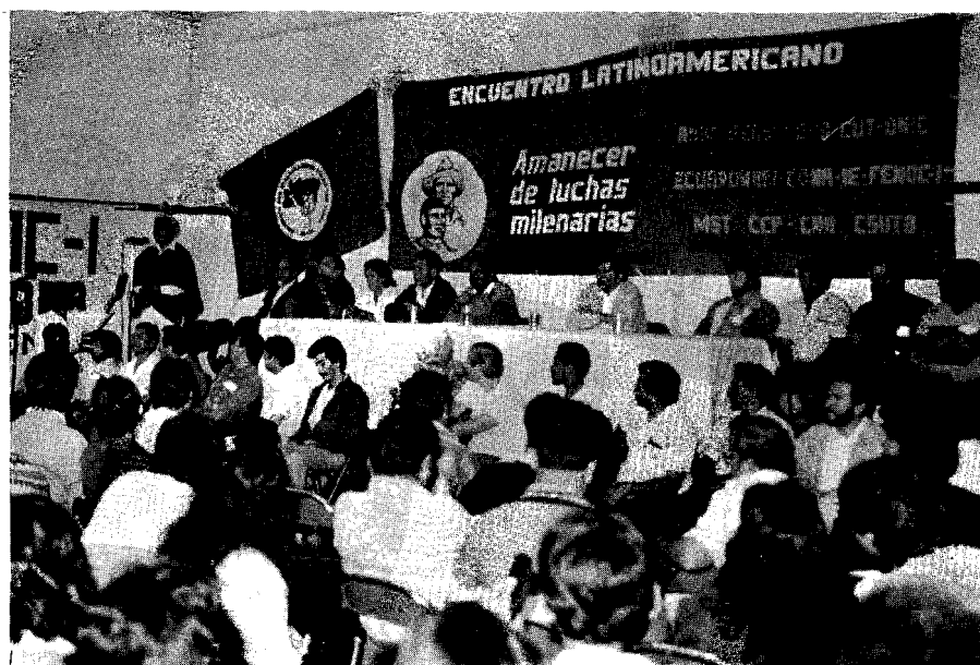
Una de las principales reivindicaciones de las organizaciones indígenas es el derecho a la tierra

No basta otorgar el crédito para la compra y legalización de tierras. Debe ser acompañado por asistencia legal, capacitación, asistencia técnica, crédito para la producción y la comercialización de obras de infraestructura de beneficio comunitario, ideas para la diversificación de la actividad productiva. Esto supone que la entidad intermediaria del crédito disponga de recursos humanos, técnicos y financieros para dar el seguimiento