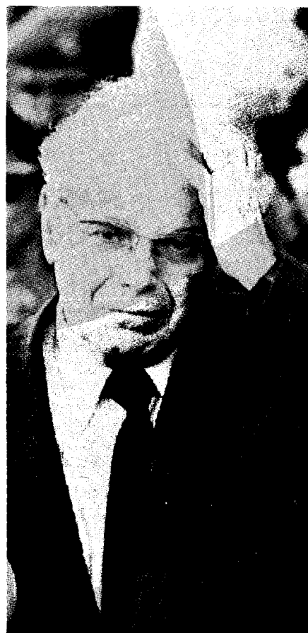
Pérez de Cuellar ¿ONU?

— Japón: Manifestantes anti-guerra han protestado en Tokio, Okinawa y Osaka.