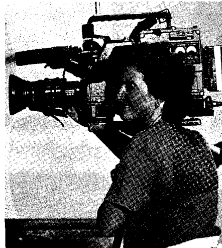
Las camarógrafas entran en acción

teralmente una ingravidez. Por medio de nuestras opiniones públicas, vamos no solamente a dar una lección sino a juzgar a los soldados que se queman en el calor del desierto y sufren. Situación delirante y falsa.