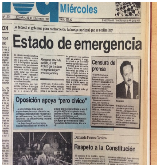
Ilustración N. 11: Diario Hoy: 28.10.1987, Primera página.