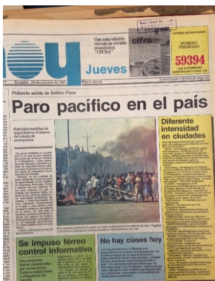
Ilustración N.12: Diario Hoy: 29.10.87: Primera página.