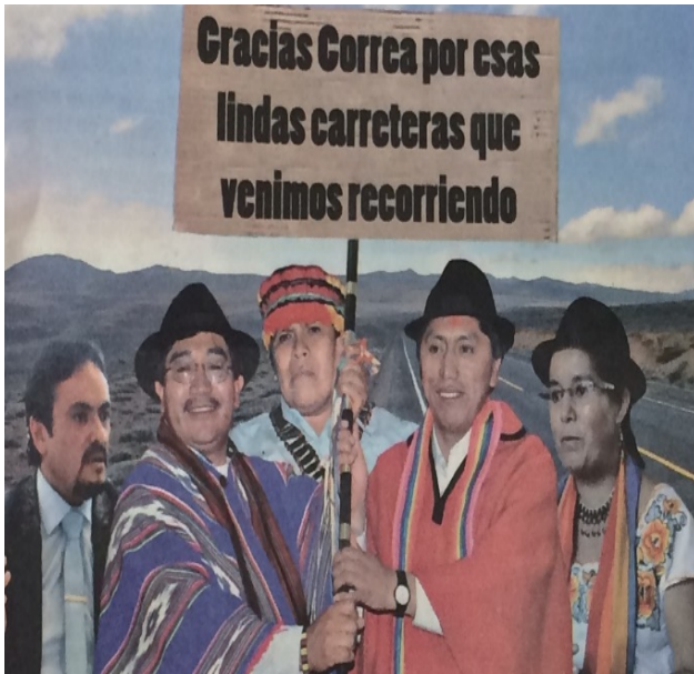
Ilustración N. 47: El Telégrafo: 23.03.2012; Sección Opinión; Página 9.

En la descripción de la travesía de la marcha, el periódico va narrando una acción de protesta dividida y con motivaciones gremiales. Además, reitera en la disolución del sentido de lo “indígena” en “oposición.”