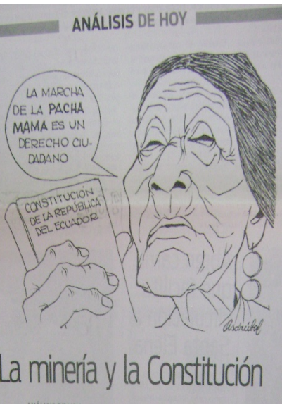
De derecha a izquierda. Ilustración N. 30: Diario Hoy: 08.03.2012, Ilustración N. 31: Diario Hoy: 09.03.2012; Sección Opinión; Página 4; Ilustración N. 32: Diario Hoy: 06.03.2012; Sección de Opinión; Página 5.