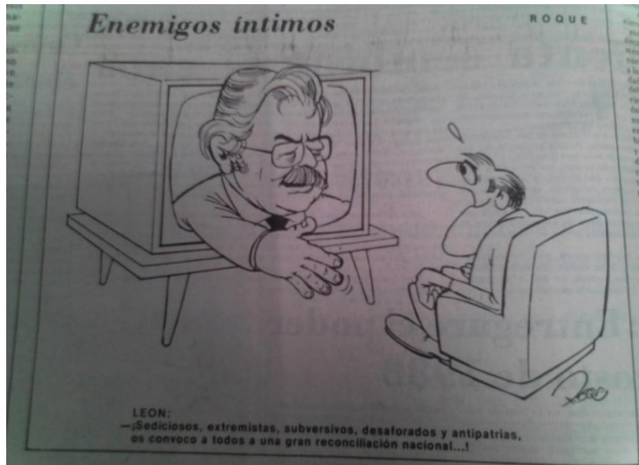
Ilustración N.9: El Comercio: 28.03.1987, Sección de Opinión: página A4.

Las posiciones de los diferentes articulistas de las páginas de opinión de cada Diario se revelan en favor o en contra de las acciones gubernamentales 56 . Tras una rápida revisión de los artículos se pudo establecer que Diario Hoy mantenía una línea de articulistas crítica al gobierno. Consecuentemente, en este Diario no se encontraron artículos de opinión que aprueben la gestión gubernamental y solo 1, de los 27, podría denominarse como neutral.