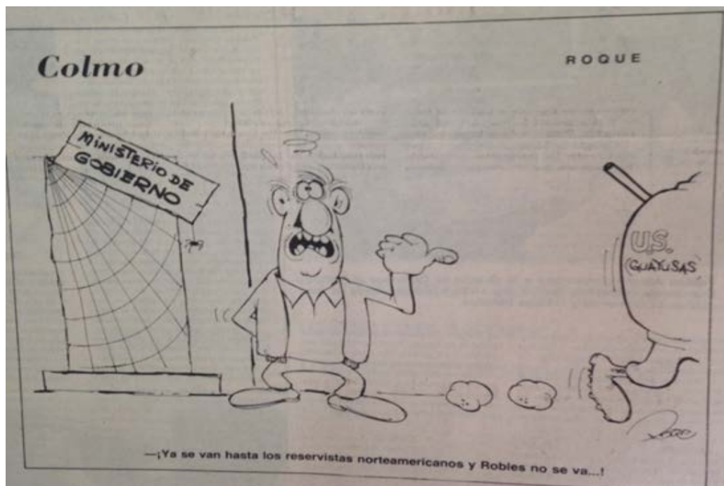
Ilustración N. 23: El Comercio: 11.11.1987, Sección Opinión, página 4A

En “Primero alza de salarios, luego de pasajes”, la séptima huelga nacional del FUT, último evento de protesta en el período de LFC, el relato se construye en medio de dos hechos importantes: un nuevo decreto de emergencia nacional y los resultados de las elecciones presidenciales de mayo de 1988, comicios en los que triunfó el socialdemócrata Rodrigo Borja.