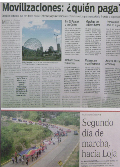
De derecha a izquierda. Ilustración N. 25: Diario Hoy: 11.03.2012, Primera página; Ilustración N. 26: Diario Hoy: 08.03.2012, La Noticia, página 2; Ilustración N. 27: Diario Hoy: 07.03.2012, Sección Nacional, página 3; Ilustración N. 28: Diario Hoy: 10.03.2012; Primera Página; Ilustración N. 29: Diario Hoy: 18.03.2012; Sección La Noticia; Página 2.