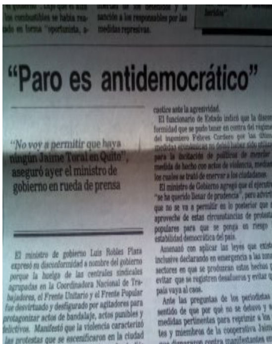
Ilustración N. 6: Diario Hoy: 28.03.1987; Primera página.

Así, El Universo en lo informativo, personaliza y enfatiza la acción eficaz del gobierno; desplaza, discursivamente, la responsabilidad de la crisis a los comerciantes; y, en la línea editorial desconoce el sentido político de la protesta y califica las demandas de los obreros