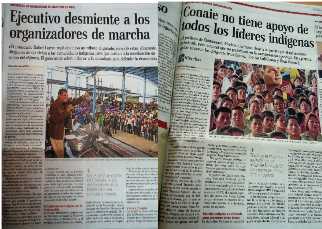
De derecha a izquierda: Ilustración N.4: El Telégrafo: 04.03.2012; Sección Actualidad; Página 3; Ilustración N.45: El Telégrafo: 07.03.2012; Sección Economía; Página 7.

El Telégrafo representa la conflictividad del contexto de la protesta, al igual que los otros diarios, con entregas de páginas enteras, fotos y gráficas.