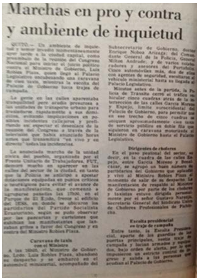
Ilustración N. 18: Diario El Universo, 28.10.1987, Sección Desarrollo, página 5.

En su primera página, el 28 de octubre, el Diario abrió con titulares como: “Marchas en pro y contra y ambiente de inquietud; Decretado estado de emergencia nacional; FUT declara paro”. En el desarrollo del titular marchas en pro y contra, retrata, principalmente, la caravana motorizada de los taxistas en Quito, en apoyo a Robles Plaza, así como hace referencia a grupos de personas que en las calles del centro de la ciudad gritaban su apoyo al Ministro censurado por el Congreso.