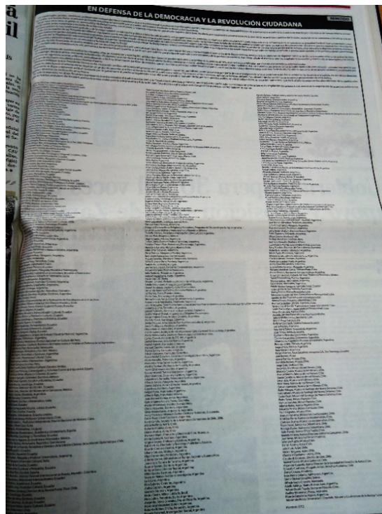
Ilustración N. 46: El Telégrafo:08.03.2012; Sección Publicidad; Página 3.

Los intelectuales, artistas, científicos, profesionales independientes y ciudadanos que suscribimos este documento, manifestamos nuestro repudio a los intentos de desestabilización de la democracia ecuatoriana, puestos en marcha por una alianza de fuerzas internas e internacionales que buscan frenar el proceso de transformación emprendido por el pueblo del Ecuador, mediante su Revolución Ciudadana” (El Telégrafo, 08.02.2012, Publicidad).