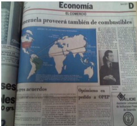
Ilustración N. 1: El Comercio: 16.03.1987; sección Economía; página D1.

Bajo igual formato, El Comercio, a partir del anuncio de las medidas económicas, desarrolló una importante cobertura en su sección económica. Recogió datos de la crisis que provocó la baja del precio mundial del barril del petróleo, hasta las pérdidas ocasionadas por el rompimiento del oleoducto ecuatoriano y la suspensión de la exportación del crudo.