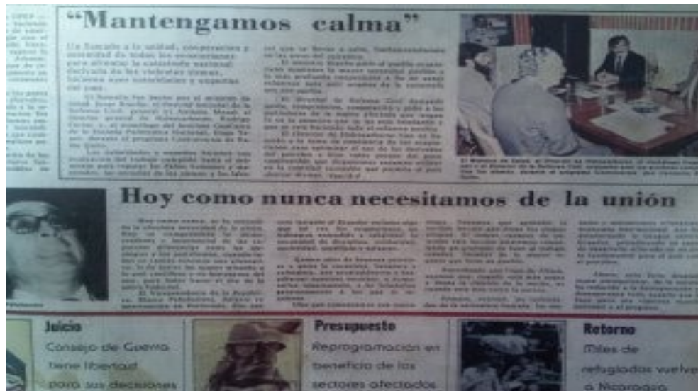
Ilustración N.8: Diario el Comercio; 19.03.1987, Primera página.