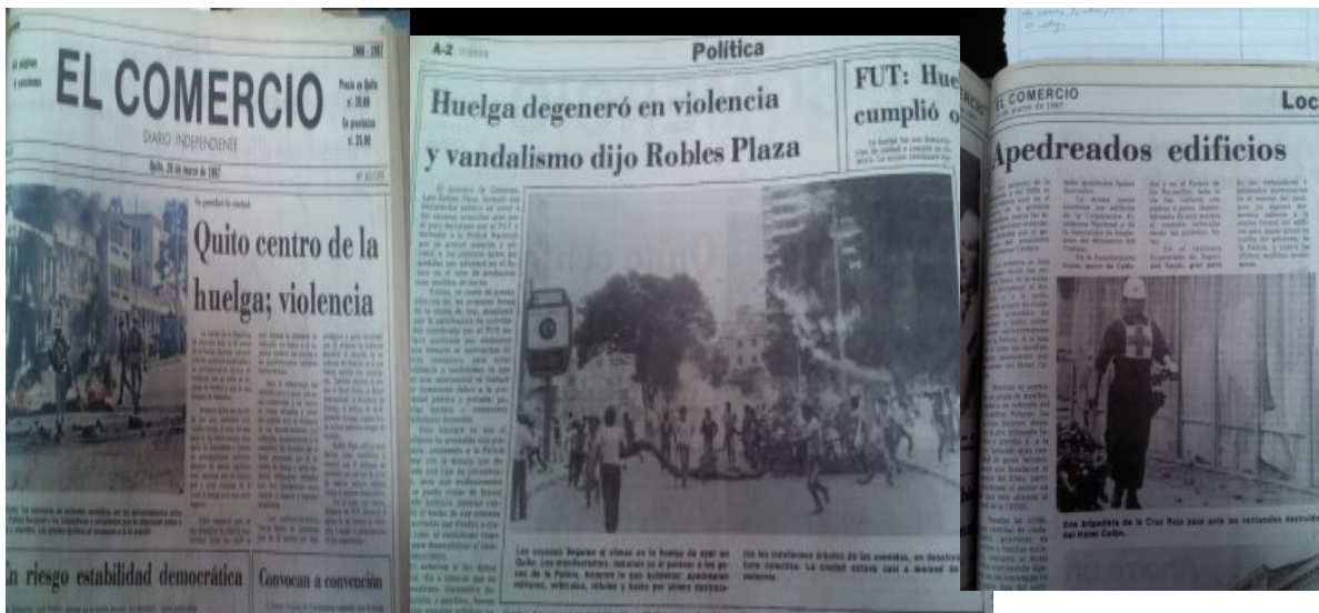
De izquierda a derecha: Ilustración N.3: El Comercio: 23.03.1987, Primera página; Ilustración N. 4: El Comercio: 26.03.1987, Sección Política, página A2; Ilustración N5. El Comercio: 26.03.1987, Sección Política, página A3.

Ahí se da una operación muy compleja en la reproducción y producción de los discursos en lo mediático: la identificación de la protesta con hechos violentos la hacen los voceros oficiales, en un claro escenario político de confrontación, que busca desconocer al otro y en su acción política. Al mediatizar este discurso político, desenfocando la acción de su proceso, el hecho pierde su dimensión política y pasa a ser tratado desde marcos interpretativos funcionales, usados y promovidos por el medio, que hacen ver un equilibrio social roto, planteándose la necesidad de su restitución, aspecto que, además implica y legitima el castigo de los movilizados, quienes traspasaron los límites convenidos. Esto puede observarse en las Ilustraciones N. 3, 4 y 5, en cuyos titulares se lee: “Quito centro de la huelga; violencia; Huelga degeneró en violencia y vandalismo, dijo Robles Plaza; Apedreados edificios”: