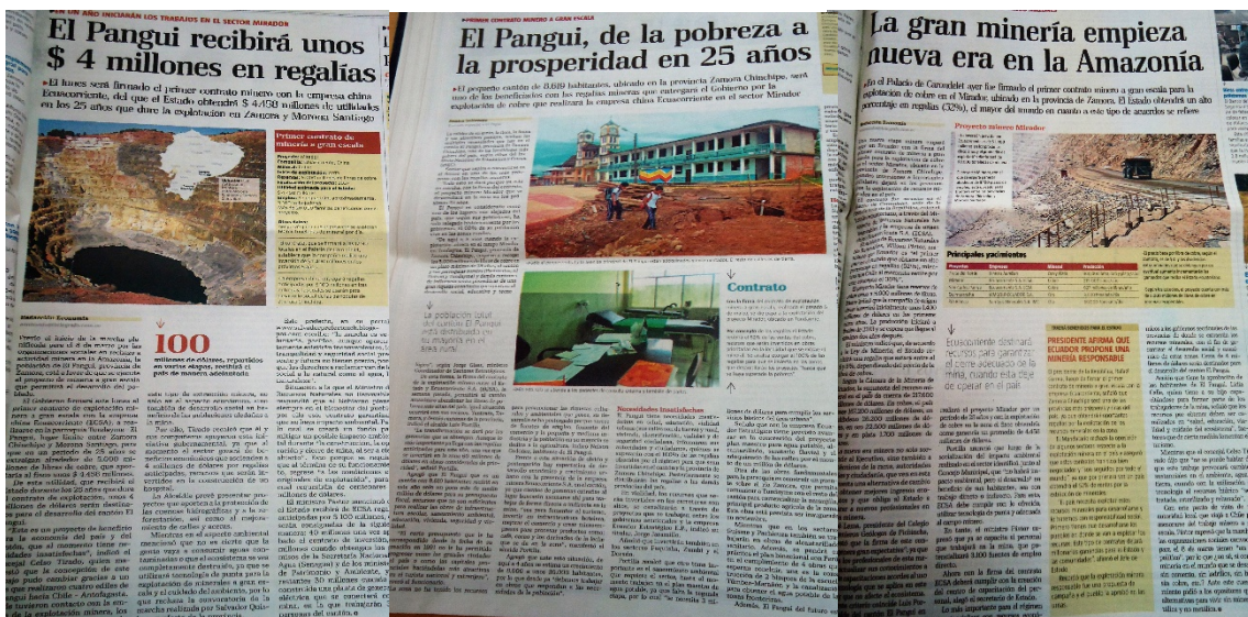
De derecha a izquierda: Ilustración N.40: El Telégrafo: 03.03.2012; Sección Economía; Página 7; Ilustración N. 41: El Telégrafo: 12.03.2012; Sección Economía; Página 6; Ilustración N. 42: El Telégrafo: 06.03.2012; Sección Economía; Página 12.

En tanto que Diario El Telégrafo tematizó en torno a las bondades de la explotación minera y, al igual que El Comercio, pero con mayor énfasis, narró un escenario de expectativas por el bienestar que esperan las poblaciones donde se encuentra el proyecto minero Mirador: “Ecuador suscribirá su primer contrato de minería a gran escala; El Pangui invertirá en la reforestación y obras públicas; regalías por explotación minera. ElPangui recibirá unos 5 millones en regalías; La gran minería empieza nueva era en la amazonia; Proyecto Mirador no afecta las reservas ni cruza la frontera; El Pangui invertirá en las obras prioritarias; El Pangui de la pobreza a la prosperidad en 25 años; Los mineros artesanales buscan reducir pérdidas; Segundo contrato minero abrirá más de 2.500 plazas de trabajo; La capa vegetal de las minas se guarda en las escombreras; Proyecto Mirador reaviva las metas laborales de los habitantes de Zamora. Mirador cambia estilo de vida en la Cordillera del Cóndor”