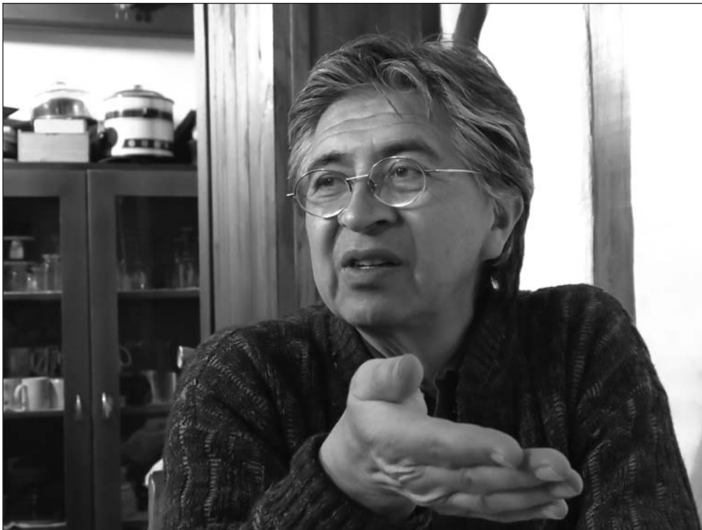
Fotografía: Jorge León, tomada por Birte Pedersen.

Su mayor contribución son sus visiones iluminadoras sobre el movimiento indígena ecuatoriano. De hecho, su libro De campesinos a ciudadanos diferentes (1994) constituye el análisis más penetrante que se hizo sobre el levantamiento indígena de junio de 1990, ese acontecimiento que constituye un parteaguas en la sociedad ecuatoriana. Su argumento central plantea cómo el levantamiento había sido el producto de una transformación de los espacios locales de poder con la desintegración de la hacienda tradicional donde pasaron a tener un rol central las organizaciones indígenas. Todo aquello que lucía enigmático en la acción conducida por la Confederación de Nacionalidades Indígenas del Ecuador (CONAIE) podía ser mejor entendido como una conjunción de dinámicas organizativas locales, acciones movilizadoras y liderazgos nuevos en el mundo indígena. El significado del acontecimiento indicaba que se había producido un cambio de época y una integración de las organizaciones indígenas al sistema político como consecuencia de las movilizaciones.