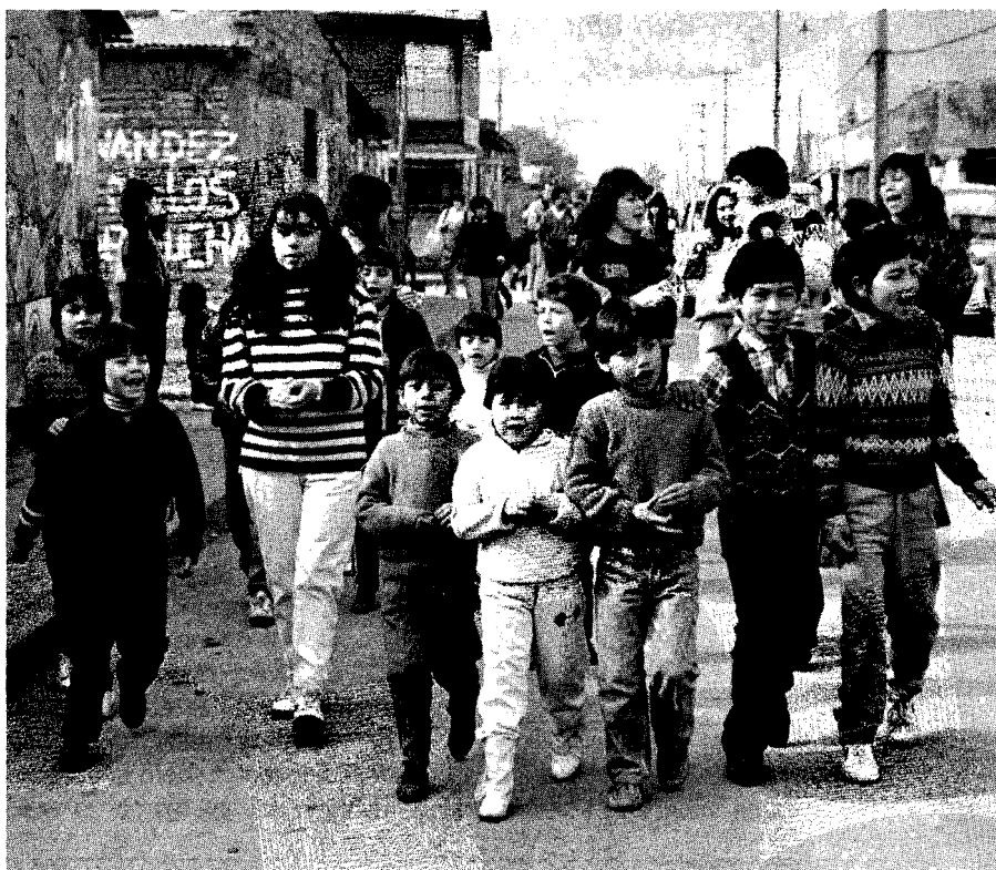
Barrio "La Victoria", Santiago de Chile, Chile

Claro, lleno de contradicciones el mundo latinoamericano y el mundo en general. A mí me ha aportado bastante como a muchos españoles y a muchos ciudadanos del mundo. En Latinoamérica hay un futuro, hay cantidad de cosas a corregir, pero hay primero espacio, luego actitudes, talentos y una forma de entender la vida más esperanzada. Esta Europa se empequeñece, se mercantiliza, se hace más mezquina y cerrada en sí misma, retomando el nacionalismo de forma exacerbada. Ahí está el caso de la ex Yugoslavia. Latinoamérica es una puerta abierta, en un futuro más o menos inmediato, y con unas posibilidades que para mí no ofrece Europa. ●