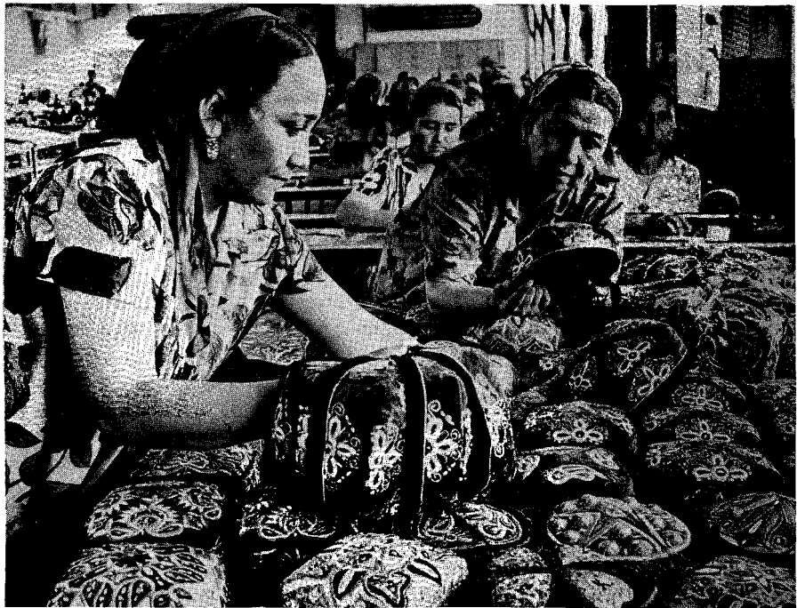
A la iglesia se le exige sensibilidad y solidaridad

L a Iglesia siente que perdió, en muchos países, también de América Latina, el papel protagonista en la sociedad. Por eso, la necesidad de un catolicismo más 'agresivo', que exige de todos los católicos la afirmación explícita de su catolicidad. Para volver a ser un eje fundamental de la sociedad actual, laica y laicizada, que es uno de los elementos de la modernidad, la Iglesia busca crear alianzas con poderes políticos y económicos. Ya no desde la periferia, desde las comunidades, desde las iglesias locales, sino desde los centros de