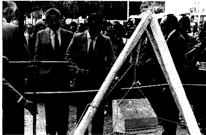
El presidente del Ecuador, Dr. Rodrigo Borja, se dispone a colocar la piedra fundacional del Estudio de Televisión

entre capacidad de emisión y pobreza de programación, ponía de relieve, mejor que nada la importancia trascendental que debía asignar CIESPAL a la enseñanza de la radio. Mediante el programa de Radio Nederland, financiado por el Gobierno Holandés y que tuvo un costo superior a los 350 millones de sucres, CIESPAL se