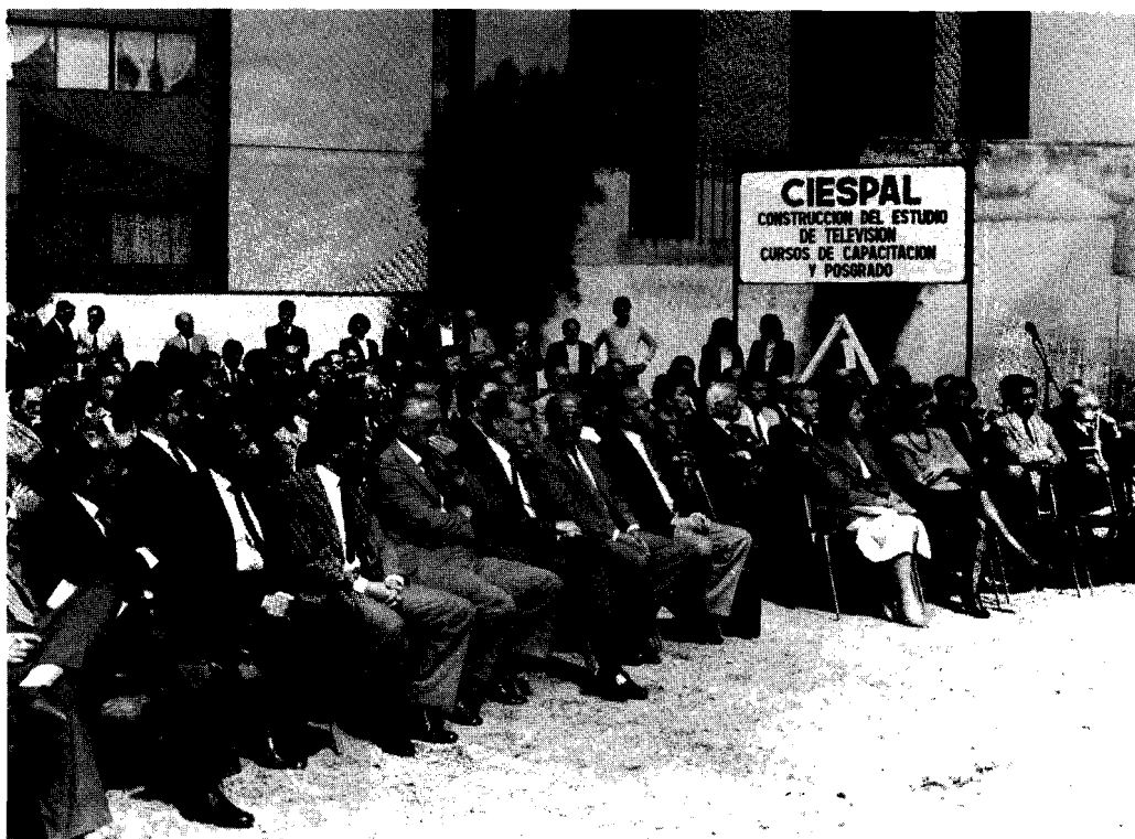
Autoridades del gobierno y de medios de comunicación y periodistas testigos de la nueva etapa que inicia CIESPAL

Nuestros lectores conocen los fatales efectos de la desinformación que aquejan a nuestros países. Estamos seguros, por eso, que sabrán aquilatar el significado de este proyecto que aspira a hacer realidad el epígrafe de la Comisión MacBride: "Voces múltiples, un solo mundo", que para América Latina podría bien significar "múltiples pueblos, un solo espíritu". ■