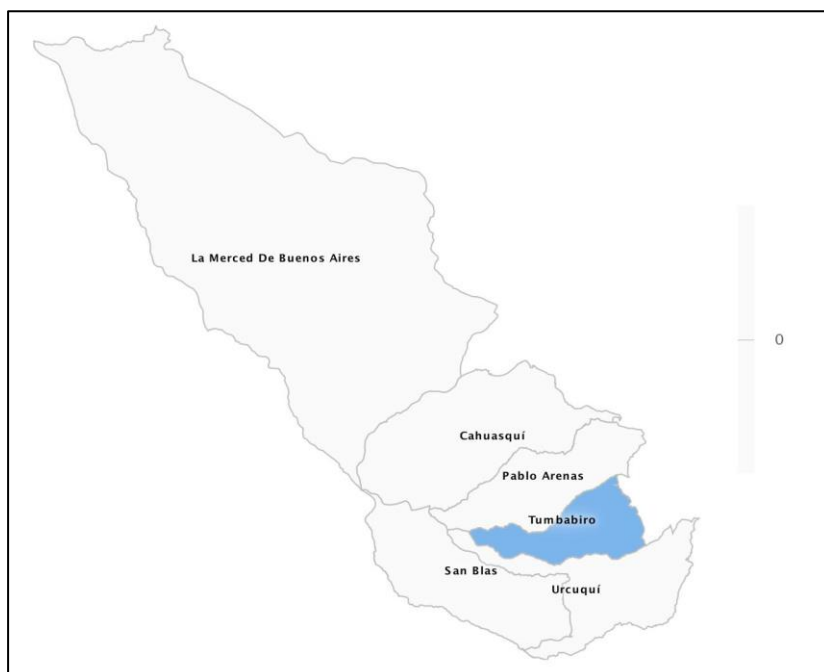
Ilustración 5. Mapa de la Parroquia Tumbabiro