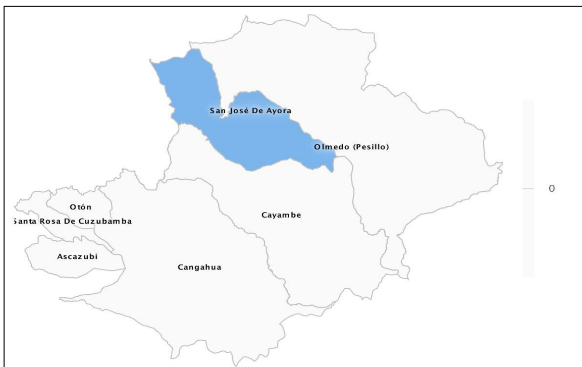
Ilustración 3. Mapa de la Parroquia San José de Ayora