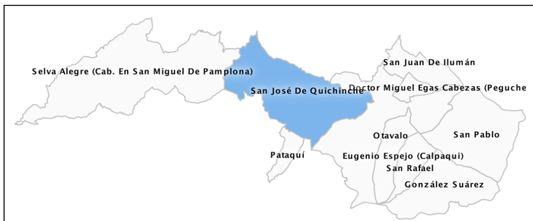
Ilustración 4. Mapa de la Parroquia San José de Quichinche