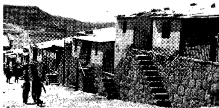
Distrito minero de Siglo XX.

La COB, como central única de los trabajadores, rebasa en su composición al proletariado clásico para abarcar a otros sectores y constituirse en la referencia fundamental del movimiento popular boliviano. Esta amplitud, donde están adscritos los campesinos, los maestros, los profesores, los universitarios, los trabajadores bancarios y otros, expli-