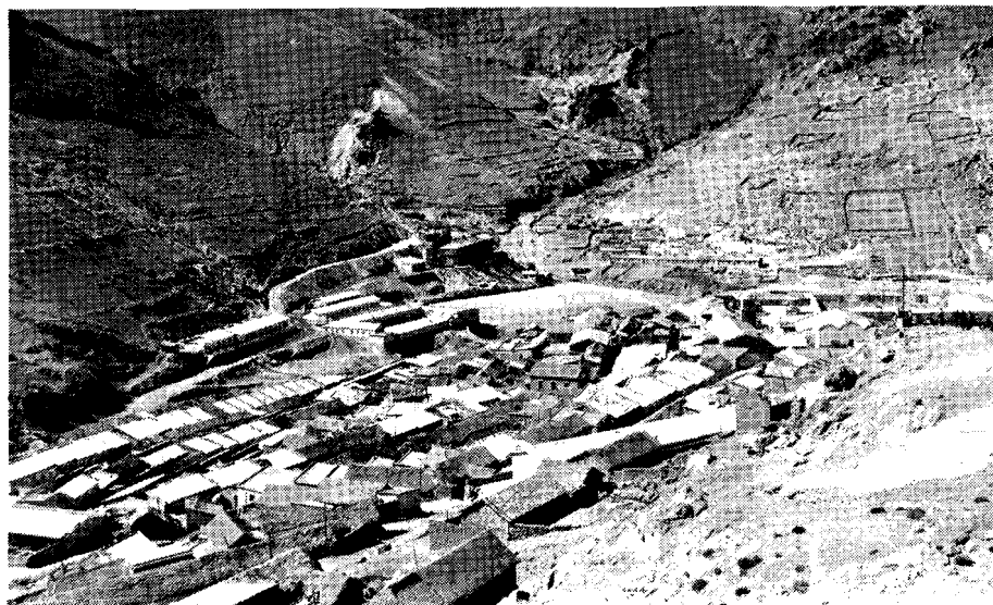
Distrito minero de Quechisla.

Luego, dirigentes y bases, constataron que sus radios estaban desvirtuándose en esta pugna mimética y la dejaron sin efecto. Se desechó esa perspectiva errónea y se fomentó la capacitación