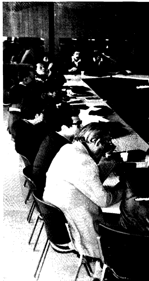
Asistentes al Seminario