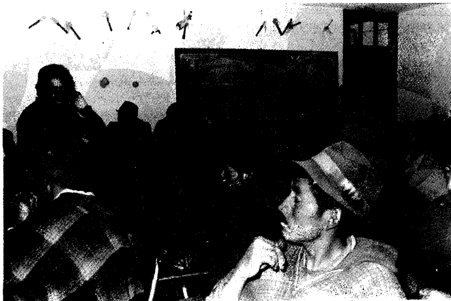
Analizando problemas locales.

Teleconferencias de audio. Es posible establecer conexiones telefónicas entre muchos países, aunque sorprende la cantidad de países a los que aún resulta imposible llegar. Por medio de las teleconferencias, se facilitan las reuniones electrónicas de grupo, altamente productivas. Pueden unirse múltiples locali-