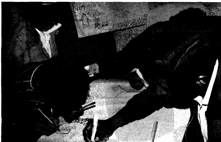
Preparación de periódicos murales en una comunidad andina del Ecuador.

Reuniones municipales. La quinta esencia del foro democrático es la reunión municipal, donde todos los ciudadanos están presentes para tomar decisiones por consenso o voto mayoritario. Esta democracia de frente a frente continúa funcionando en pueblos pequeños del noroeste de Estados Unidos. Pero las concentraciones poblacionales de la actualidad dificultan esto. El cable interactivo ofrece una forma de vencer el problema de las dimensiones. Cada hogar de la comunidad está alambrado por cable y tiene una almohadilla de respuesta que conecta a cada familia a la estación receptora central. Pueden así indicar sus respuestas a los votos, las preferencias, las urnas y a otras cuestiones oprimiendo el botón adecuado en su almohadilla de respuesta.