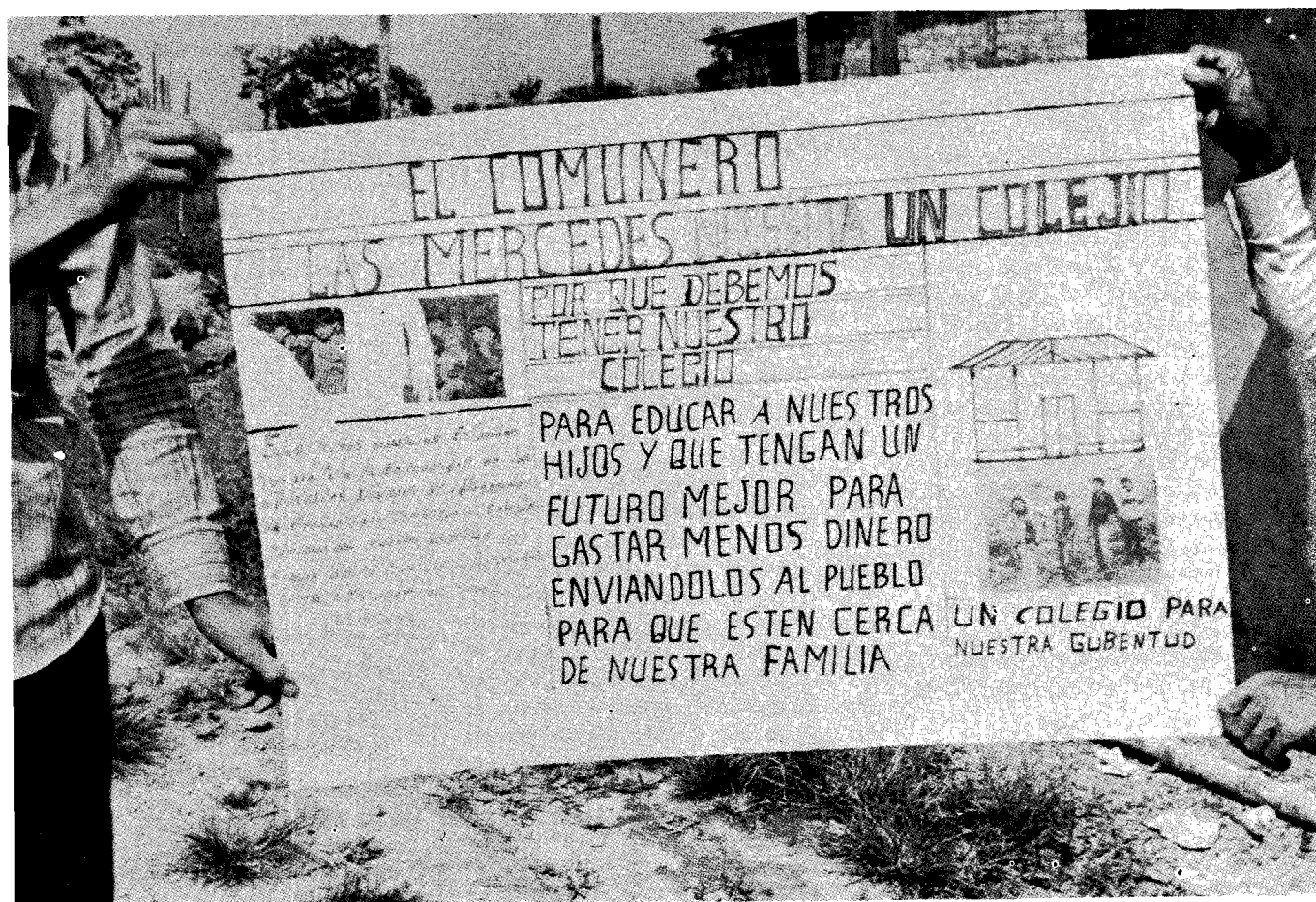
Comunicación Popular, inseparable de la Comunicación Educativa.

- La comunicación, cuando es concebida como un proceso dinámico en el que participan todos los sujetos involucrados, genera mayores niveles de acción de los individuos frente a su realidad.