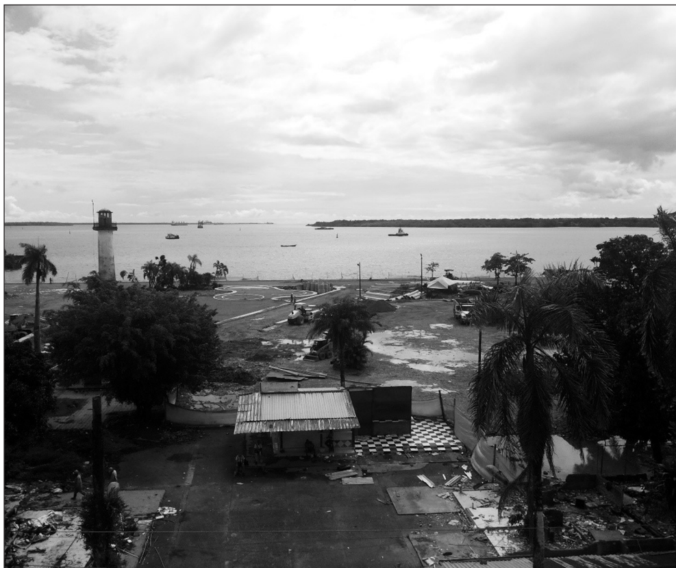
Imagen 6. El proyecto del malecón hacia 2016, ¿desarrollo local o expulsión de la vida?