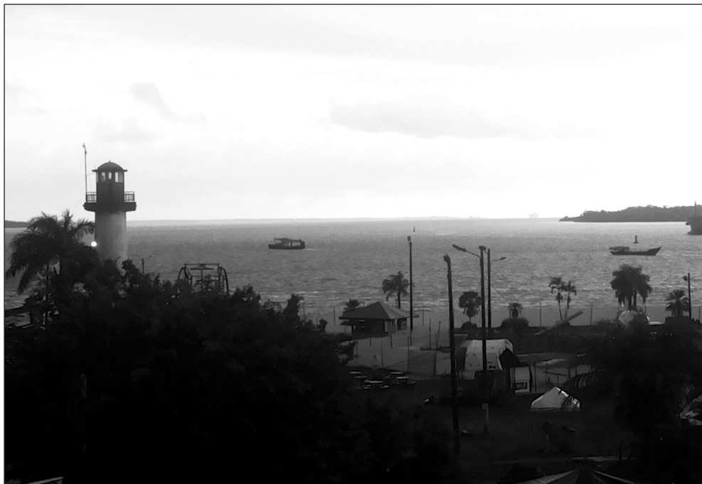
Imagen 5. La “ciudad puerto” evocada desde el lente

Siguiendo lo sugerido por el ensayista antillano Édouard Glissant (citado por Bojsen 2008), en el sentido de que naturaleza y poblaciones son “personajes activos de la historia”, consideramos que en el Pacífico sur y en Buenaventura se condensan, acontecen, fracturan y reinventan ambos personajes, paradójicamente, en medio de geografías violentadas y experiencias de reexistencia.