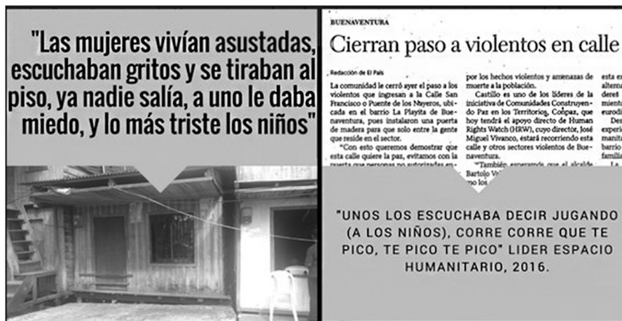
Imagen 2. Geografías del miedo invadiendo cuerpos y voces de mujeres y niños

2) construir una geografía del miedo que invade cuerpos y voces (imagen 1) y que obliga a esta nueva comunidad a perder sus sentidos de lugar y sus referentes espaciales y territoriales mediante un gran plexo de mecanismos, entre otros: desplazamiento forzado; despojo de los territorios, saberes y prácticas; ruptura del lazo rutinario y afectuoso en la manera de relacionarse con los otros y el entorno.