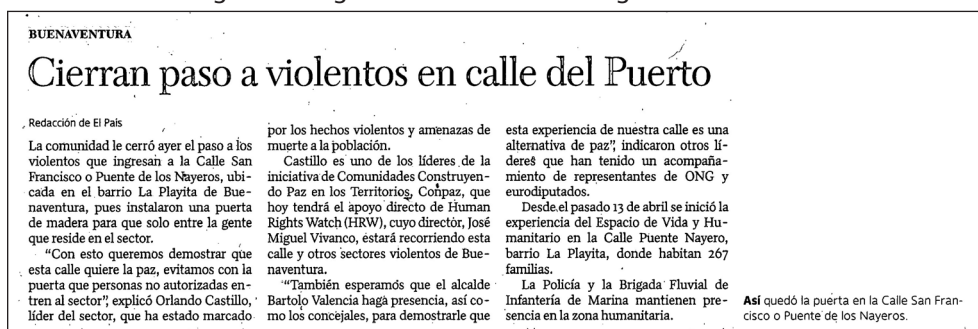
Imagen 4. Resignificando la calle desde gramáticas de vida

Hay una cosa aquí en el Pacífico y es que nosotros somos más orales... La lectura que nosotros hacemos [de la realidad local] la hacemos a través de la palabra, de las imágenes. El teatro es una herramienta que permite que esa costumbre se mantenga, o sea que yo te cuento, tú me cuentas y entre todos vamos reconstruyendo esa memoria y luego esa memoria otro la coge y la va contando también... Para esta parte de Colombia, es supremamente importante el tema del teatro, ¡el tema de la poesía sí!... El teatro nos permite estar allí con la gente y nos hace más sensibles frente a la situación que estamos viviendo (entrevista miembro del Semillero de Teatro por la Vida 2017).