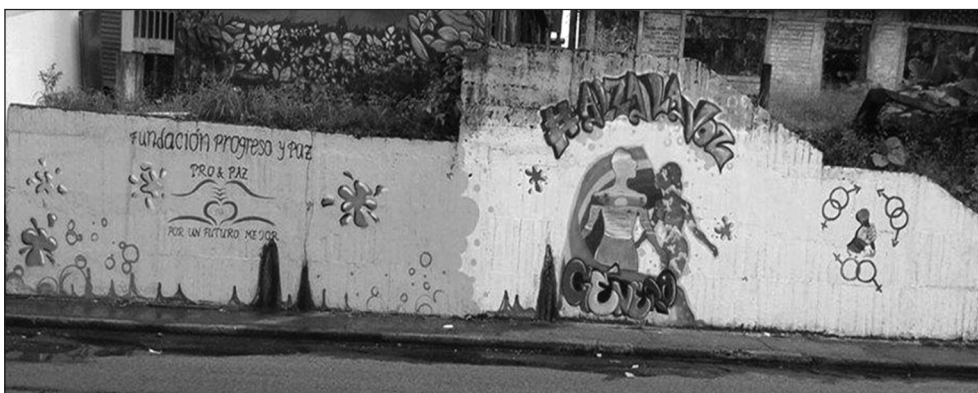
Imagen 8. Alzando la voz por la vida en los territorios violentados