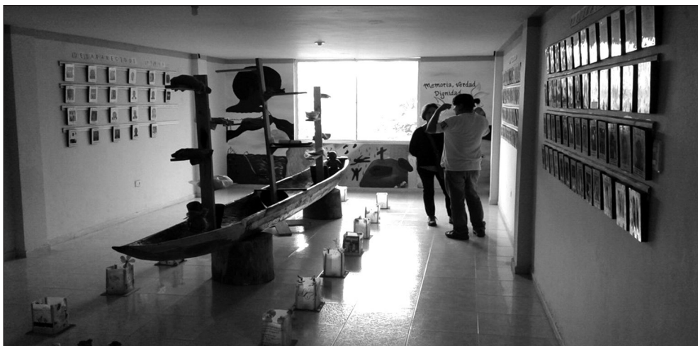
Imagen 7. La Capilla de la Memoria y el recuerdo transformador