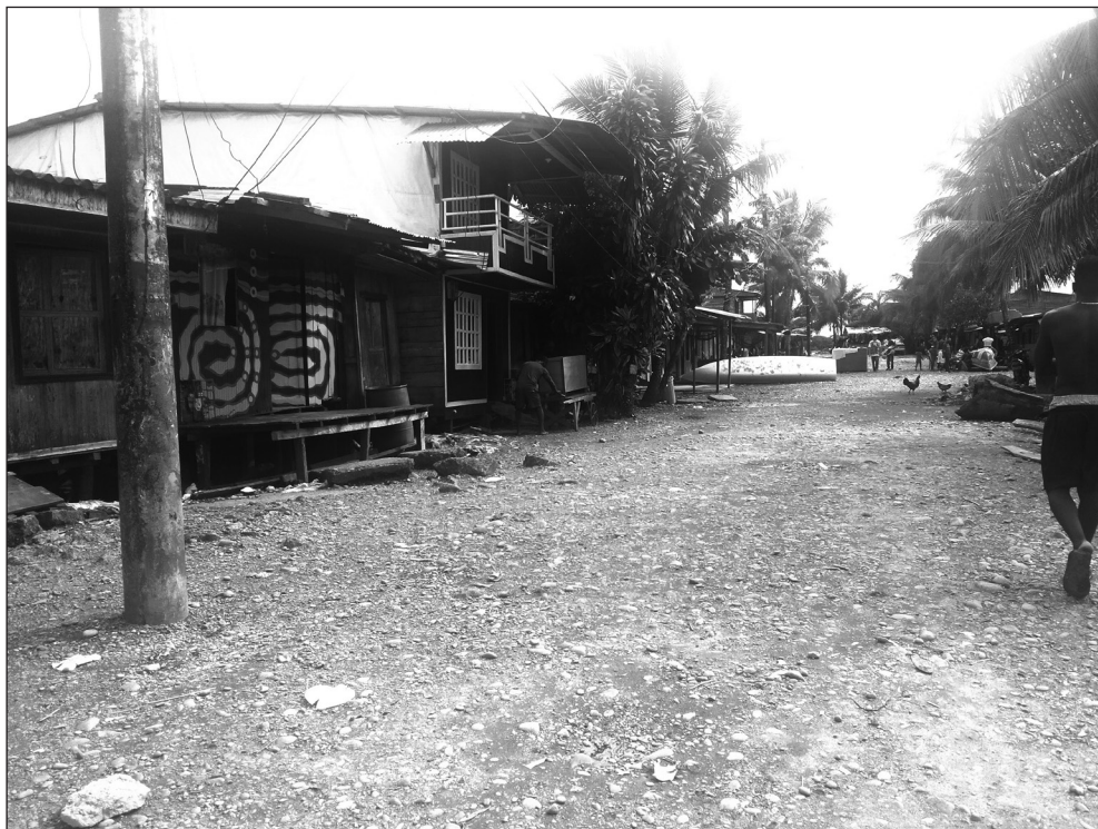
Imagen 3. Puente Nayero: de lugar de confinamiento a espacio humanitario