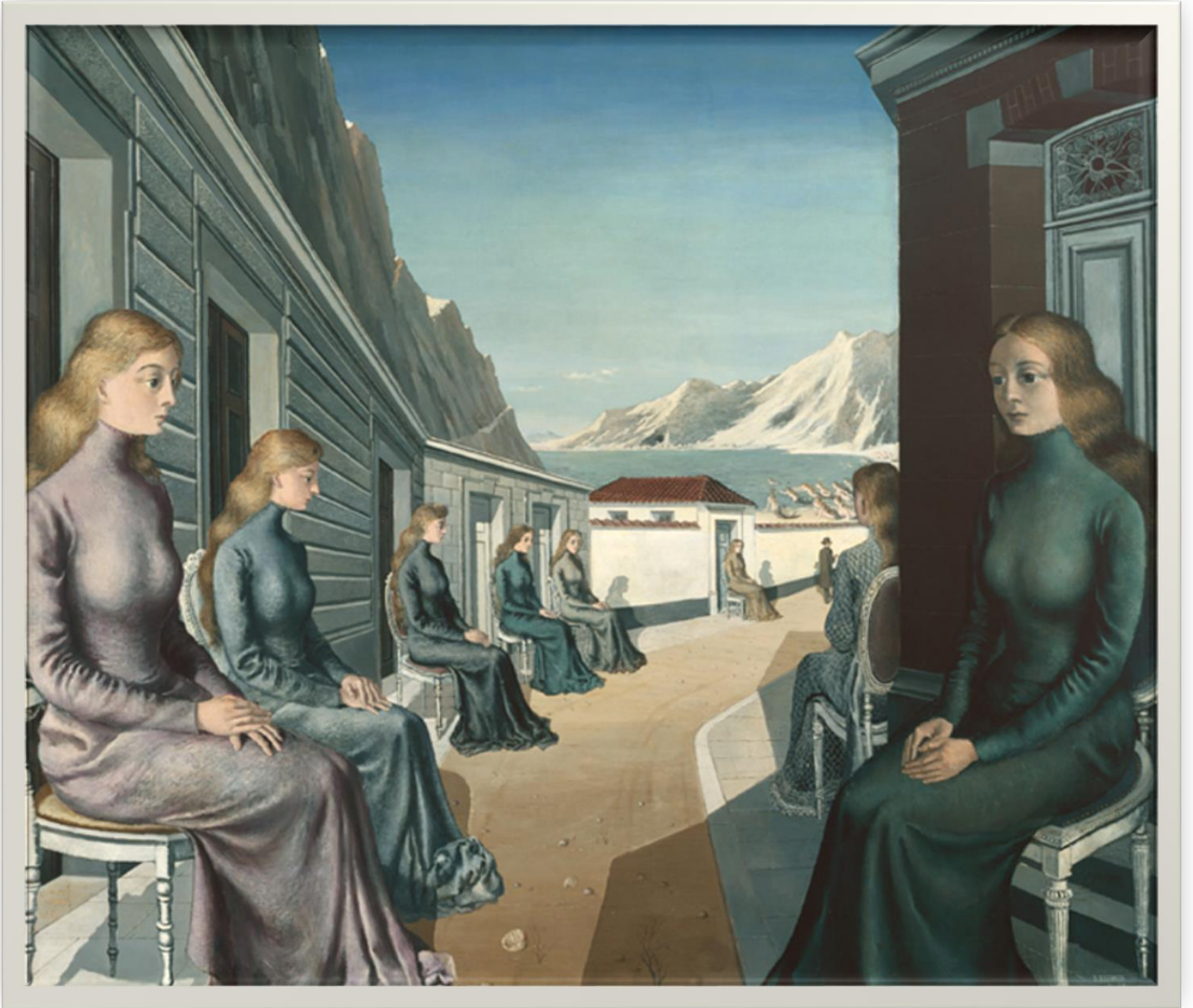
El pueblo de las sirenas, Paul Delvaux, 1942