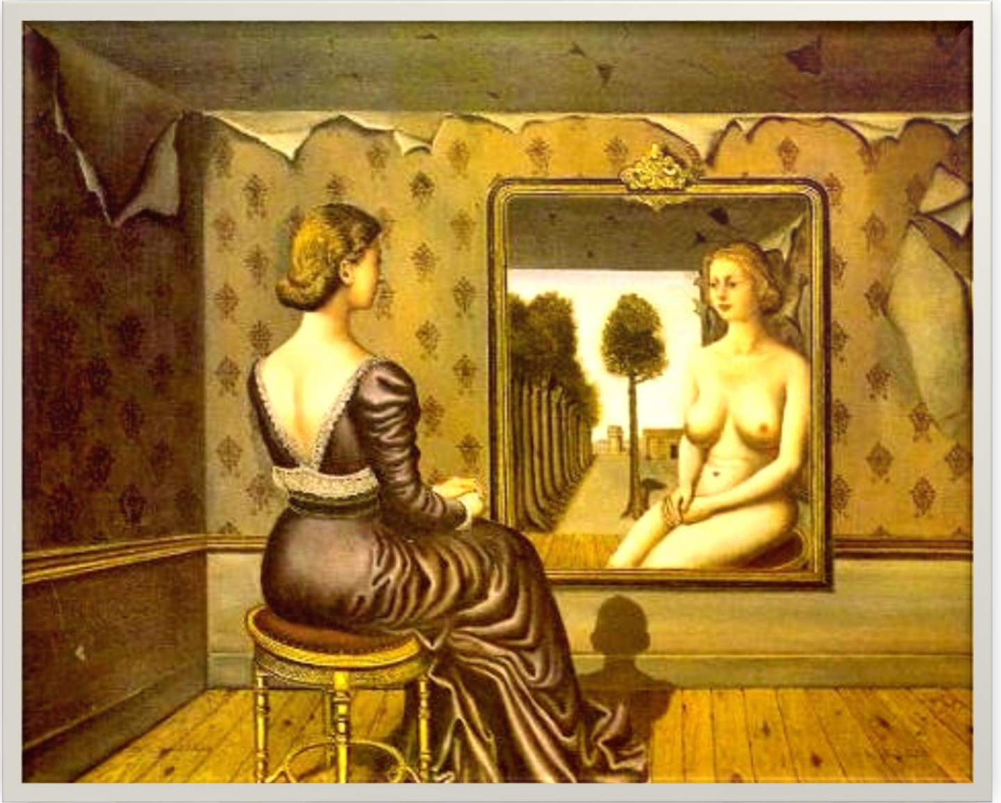
La mujer en el espejo, Paul Delvaux, 1939