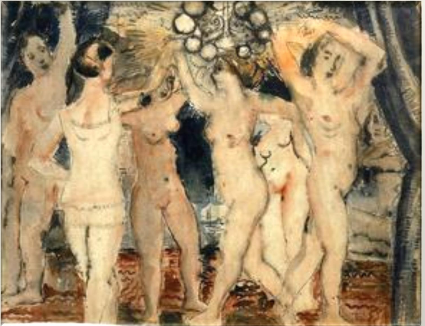
Baile, Paul Delvaux, (s.f.)