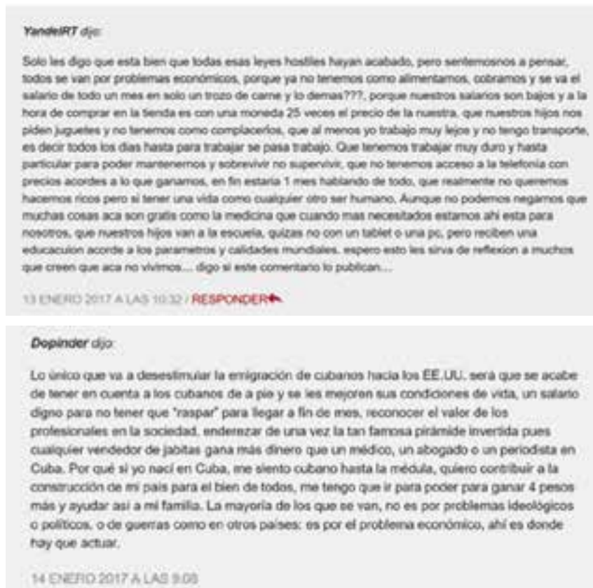
Figura 4: Comentarios de la conversación analizada (IV)

Observamos así que las posibles contribuciones que la conversación cotidiana informal puede ofrecer para la construcción del sujeto autónomo dependen intrínsecamente de su apertura al conflicto. Aparecen aquí dos elementos fundamentales que sirven como ejes del debate: la relevancia del matiz económico y su conexión con posicionamientos políticos; y la relación de esa dimensión con valores morales como el trabajo digno y la familia. Las narrativas construidas por los participantes del foro permiten comprender la razón por la cual un problema individual debe ser considerado como una cuestión ligada a la falta de reconocimiento que afecta a todos. La utilización del testimonio en situaciones de conversación informal ofrece la oportunidad de percibir la situación a partir de la perspectiva del otro, lo que puede influenciar cambios en los modos de pensar y de comprender las historias individuales y colectivas (Black, 2008; Young, 2000).