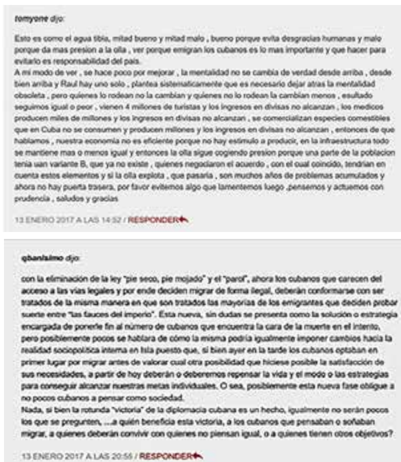
Figura 2: Comentarios de la conversación analizada (II)

que fue eliminada; mientras que la expresión “olla de presión” es utilizada para ilustrar la tensión al interior de la sociedad cubana. Esa lógica reflexiva construye una representación de la migración como necesaria para evitar el desencadenamiento de una crisis nacional. La imagen revela una preocupación por las posibles consecuencias que el anuncio de Obama puede traer para Cuba, lo que puede representar tanto un agravante de la incertidumbre ya existente, o bien un estímulo para la resolución de los problemas internos que provocan el amplio flujo migratorio. Se manifiesta también en el debate una tendencia a desmitificar que la hostil política estadounidense sea la principal causa de la emigración, ya que son expuestas las condiciones internas que llevan a los cubanos a emigrar a pesar del alto costo de esa decisión.