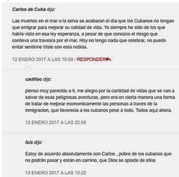
Figura 5: Comentarios de la conversación analizada (V)

Un elemento importante que fundamentó los criterios expresados en la conversación analizada fue la perspectiva humanitaria que, de cierta forma, constituye el punto de encuentro entre las posiciones del Sí y el No: la mayoría de las opiniones que evalúan la decisión de Obama tiende a considerar como elemento positivo que, en efecto, esa medida contribuye a reducir las muertes de cubanos durante la travesía migratoria ilegal, al eliminar el principal estímulo para los emigrantes ilegales en el país de destino. De esa forma, se construye un punto común entre los interlocutores, aunque esa visión de preservación de la vida humana como bien supremo se contrasta continuamente con un contexto social más amplio en que no parece haber otras opciones de vida sino la salida migratoria.