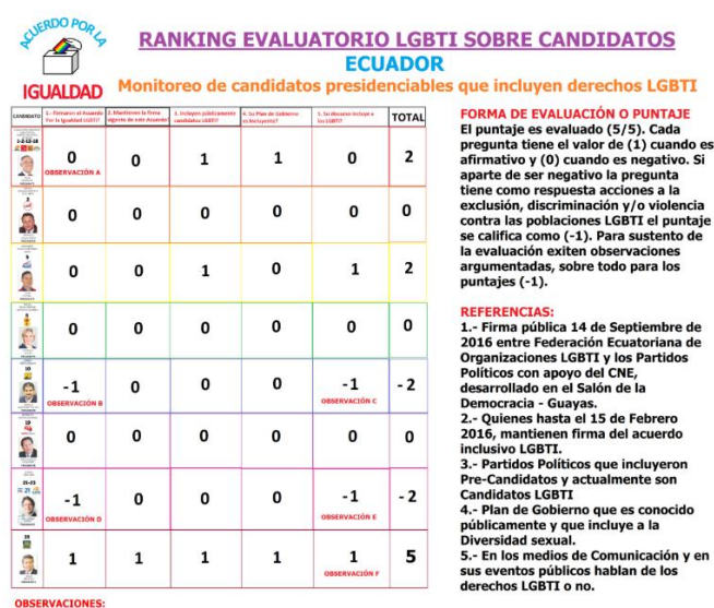
Figura 5.4 Ranking Evaluatorio