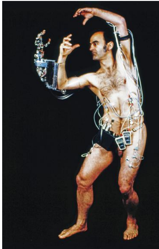
Imagen 10. Stelarc. Third hand , 1980.