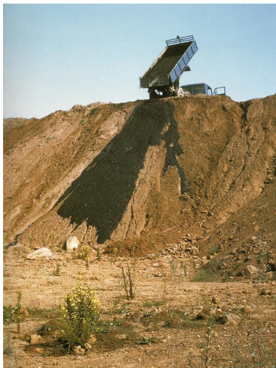
Imagen 5. Robert Smithson, Asphalt Rundown , Italia 1969. Acción /intervención en las afueras de Roma.

Así, esta entropía también es cultural, es un desgaste de sistemas económicos y sociales que, cada vez más, se integran y se interrelacionan, generando al final una homogeneización de la cultura humana (Smithson 1993). Llegará un momento en que conoceremos tanto el futuro y tan poco el pasado, que se confundirán y se invertirán; Smithson sostuvo que “el futuro no es sino lo obsoleto, pero en sentido inverso” (Raquejo 1993, 18). En ese escenario, el individuo debe asimilar lo consumado sobre el territorio a su mundo simbólico, desplazando la razón para que esta asimilación resulte espontánea y, a través del arte, sea sublimada, es decir, el hombre debe mirarse a sí mismo a través del arte, observar el escenario que ha creado y asimilar las consecuencias visibles y físicas a su cultura.