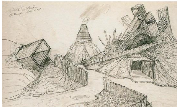
Imagen 7. Robert Smithson, Island Project , dibujo, 1970.