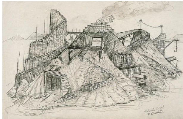
Imagen 6. Robert Smithson, Entropic landscape , dibujo, 1970.

Robert Smithson propone un retorno a la estupidez de la visión, señalando que todos los conceptos abstractos son ciegos y que el pensamiento de lo visible y espontáneo debe cuestionar el espacio del lenguaje y su relación con la memoria, generando un paisaje entrópico y adhiriéndolo a una realidad cotidiana 6 . Con dichas prácticas artísticas pretende vaciar de significado a estos elementos para después resignificarlos estéticamente desde una mirada sin prejuicios. Así, relega el uso del pensamiento abstracto en la contemplación y encuentra en esos elementos características estéticas que se asimilen espontáneamente como paisaje.