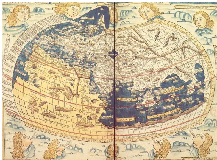
Imagen 1. Mapa Mundi reconstruido a partir de la Geografía de Ptolomeo. Johannes de Armsrhein, 1482.

El mapa refleja la relevancia de la imagen, producto de un proceso artístico que combina procedimientos científicos en un solo objeto fundamental para el desarrollo del “progreso”, pues permitieron rutas comerciales globales por mar y por tierra, estrategias bélicas, localización de recursos, delimitación de fronteras o la gestión de territorios. Para finales de siglo XIX, los procesos representacionales de la geodesia adoptarán, gracias a la tecnología, un perfil eminentemente tecnológico/científico, gracias a la inclusión de la fotografía aérea. Desde los inicios del siglo XX, la interrelación entre arte y ciencia se irá diluyendo, inclinándose su peso hacia la esfera científica.