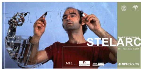
Imagen 8, Imagen 9. Stelarc en Lima. Afiche de su presentación en la Municipalidad de Miraflores en 2001.

Un ejemplo claro de su pensamiento es la performance titulada Evolution , donde utiliza una tercera mano robótica, construida a la misma escala que su mano derecha y acoplada al brazo del artista como un añadido al cuerpo. Los movimientos de esta tercera mano son controlados por el artista a través de impulsos eléctricos de los músculos abdominales y de la pierna izquierda, consiguiendo así un movimiento independiente de las tres manos (imagen 8, imagen 9). Con la disponibilidad de tres miembros independientes (una obvia ventaja al cuerpo orgánico) Stelarc escribe de manera simultánea la palabra Evolution , es decir, cada mano escribe las tres letras respectivas, para componer la palabra al mismo tiempo. Es una acción simple, pero potente, que nos invita a reflexionar sobre los alcances de una nueva naturaleza del cuerpo y las posibilidades que se abren al asimilar la idea.