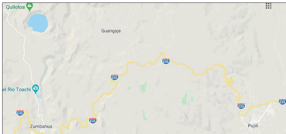
Mapa 1. Ubicación geográfica de las comunidades indígenas y unidades educativas

Elaboración propia a partir de Google Maps.