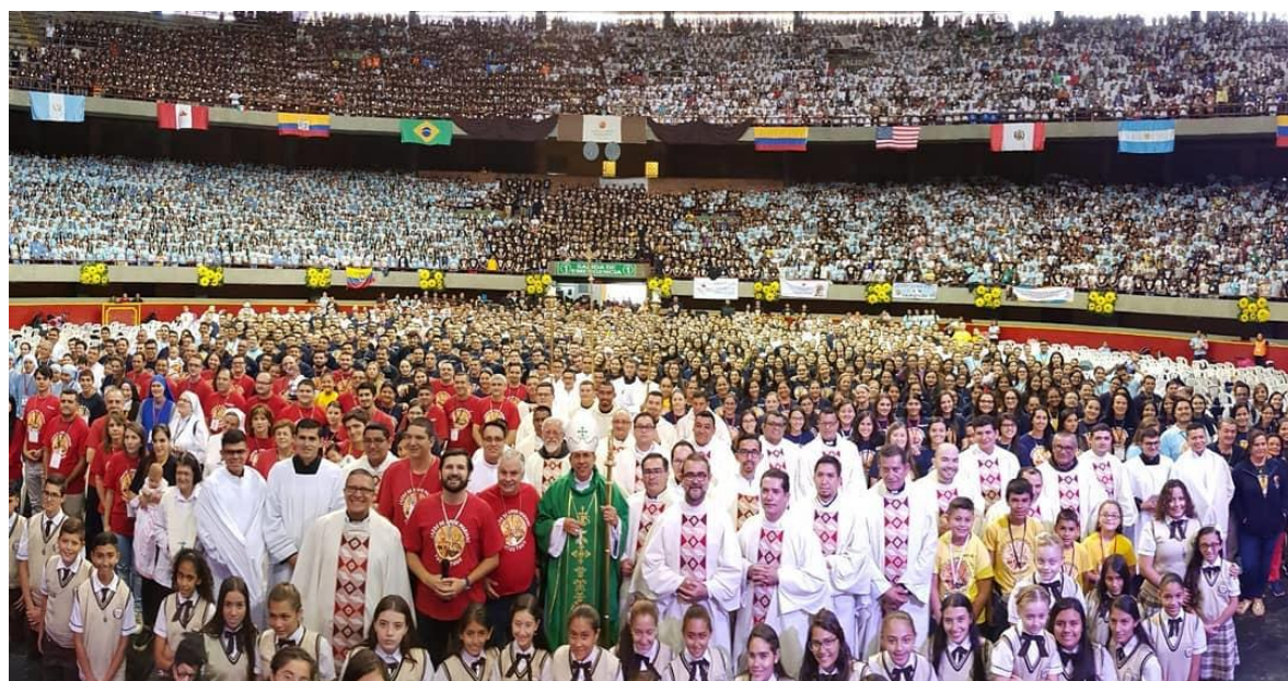
Fotografía 1: V Congreso de espiritualidad de LAM realizado en Medellín en agosto del 2018.

Lazos de Amor Mariano (LAM) es una asociación privada de fieles que se fundó en Medellín en 1999 cuando su director, un laico, propuso formar un grupo de oración para que los jóvenes y sus familias puedan formarse en la doctrina católica. A pesar de que LAM se haya fundado como una pequeña comunidad en Colombia, en los últimos 20 años ha tenido un crecimiento exponencial en toda América. Actualmente cuenta con sedes en Colombia, Ecuador, Venezuela, Perú, México, Uruguay, Brasil, Estados Unidos, España, Guatemala y Argentina. En Ecuador, LAM cuenta con 16 sedes distribuidas en las principales ciudades del país. 33 A pesar de ser un movimiento que se encuentra en diferentes territorios y se enfrenta a diferentes contextos, LAM opera de la misma forma en todas sus sedes, ya que todas las sedes comparten las mismas características y motivaciones.