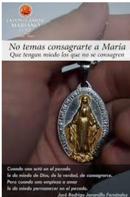
Imagen 4. Invitación a la consagración