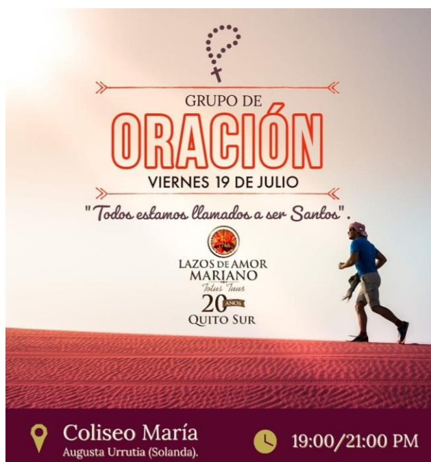
Imagen 5. Invitación al grupo de oración