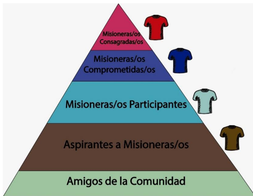
Imagen 1. Organigrama de LAM