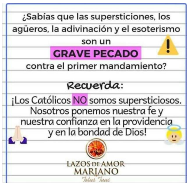
Imagen 3. El esoterismo es un grave pecado

la diversidad de creencias y formas espirituales de vivir. Esto provoca que se conviertan en un enemigo de la Iglesia, porque hace que tengamos fe en cosas y personas, dejando a dios a un lado 71 (Anotaciones diario de campo, 8 de febrero 2019).