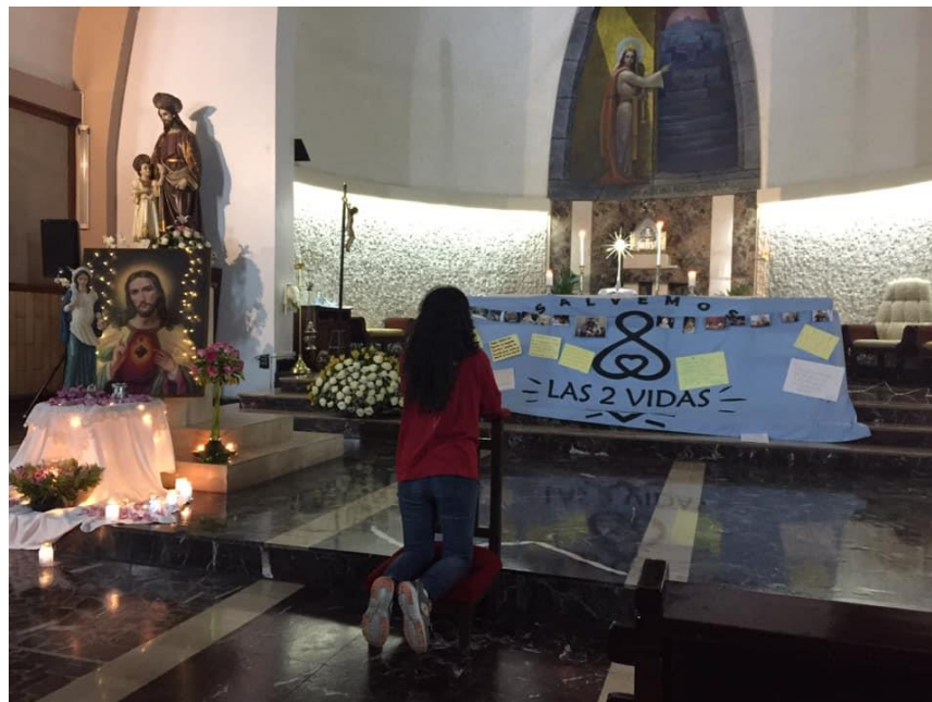
Fotografía 2. Vigilia de oración en contra del aborto y el matrimonio igualitario

Durante las vigiliass de oración de LAM, la bandera “salvemos las dos vidas” se ubica en el altar de la iglesia, cerca de la imagen de la virgen y de Jesús. “Salvemos las dos vidas” símbolo de la lucha en contra del aborto se relaciona con los símbolos religiosos durante un acto de oración, permitiendo que se conjuguen la doctrina con los discursos seculares sobre la participación política de las/os laicos. En la vigilia de oración, la bandera “salvemos las dos vidas” queda bendecida y legitimada por la Iglesia y su doctrina, convirtiéndose en un símbolo más en la batalla espiritual y la lucha en contra del demonio. Esto revela que los espacios espirituales se convierten en espacios de contienda política.