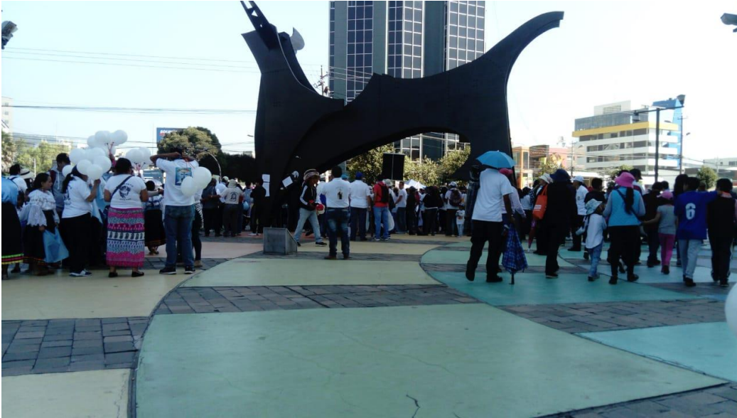
Fotografía 3. Llegada de las/os misioneras/os al punto de encuentro de la caminata “el amor en movimiento”.

El punto de encuentro era el lema “Ecuador ama la vida” ubicado en la plaza del Ministerio de agricultura, ganadería y pesca (MAGAP). Este punto de encuentro no fue al azar, sino que resulta una estrategia debido a que estos movimientos “pro vida” constantemente anunciaban su amor por la vida. Si bien este lema tiene otro significado, ya que es publicidad generada por el gobierno para promocionar el turismo, el hecho de que afirme que el país ama la vida les permite engancharse y utilizarlo como propio y como el inicio de su movilización.