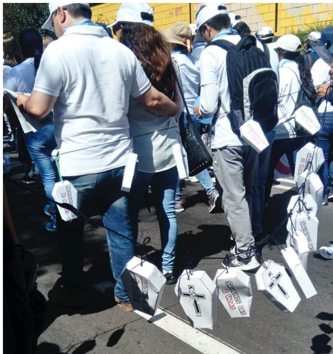
Fotografía 4. Ataúdes de los fetos en la caminata “el amor en movimiento”