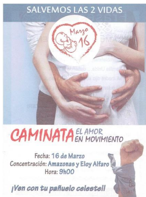
Imagen 7. Invitación a la caminata “el amor en movimiento”