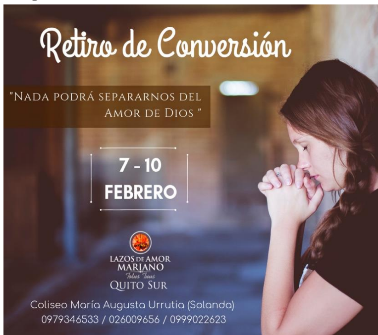
Imagen 2. Invitación al retiro de conversión febrero del 2019