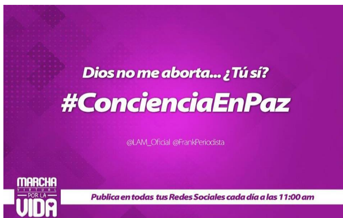
Imagen 6. Invitación a publicar en contra del aborto en redes sociales