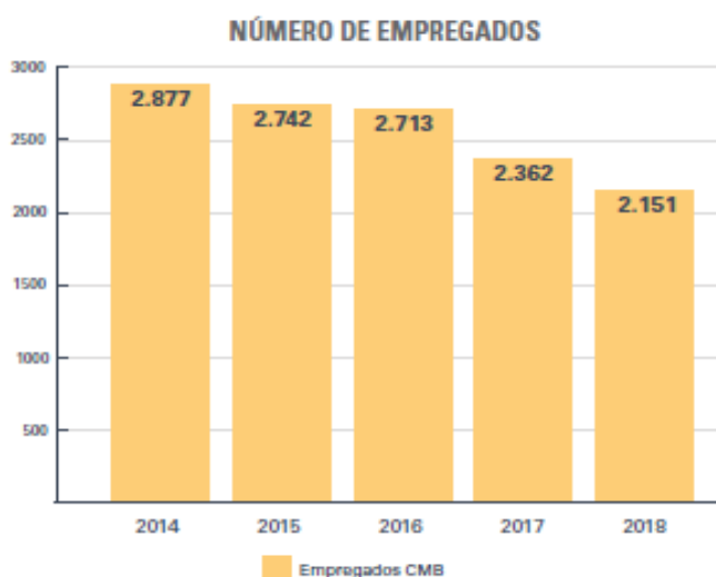
Gráfico 2 – Número de empregados no período de 2014 a 2018