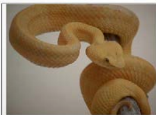
Fig.5. Fotografía de Bothriechis schlegelli obtenida en el serpenteario de UDO. Estado Anzoátegui.