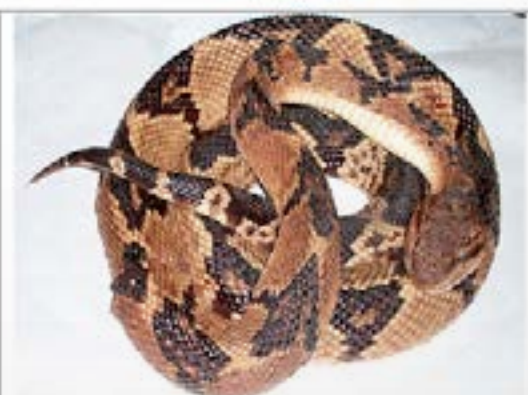
Fig.6. Fotografía de Lachesis muta , (cuaima piña), obtenida en el serpenteario de UDO. Estado Anzoátegui.