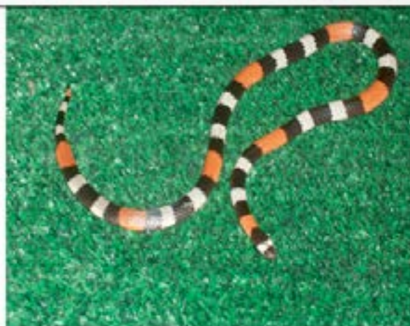
Fig.4. Fotografía de Micrurus spp obtenida en el serpenteario de UDO. Estado Anzoátegui.