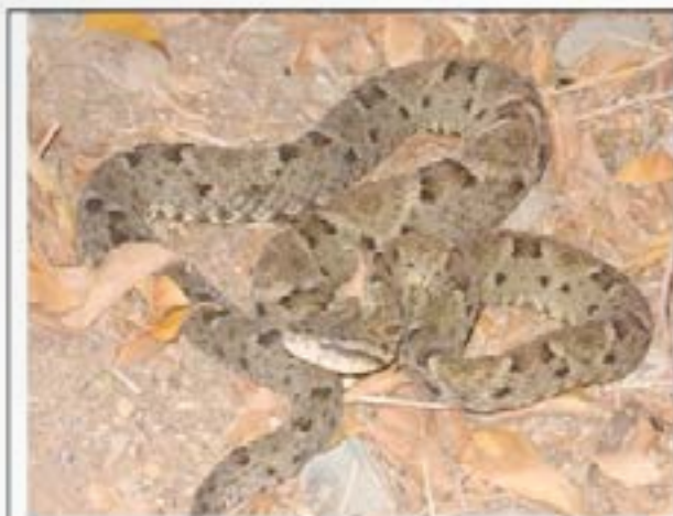
Fig.3. Fotografía de B. atrox obtenida en el serpenteario de UDO. Estado Anzoátegui.

c.- Región del Centro, con contraste de ambientes y nichos ecológicos, posee flora y fauna representativa, espacios naturales con gran valor potencial, escénicos, fragilidad ambiental y recursos naturales excelentes para la práctica de actividades turísticas y recreacionales. En el Hospital Central de Maracay, estado Aragua, período 2000 a 2006 la casuística fue de 92 casos. La información clínica epidemiológica fue procesada mediante EXCEL y EPIINFOV6 (15), Bothrops spp. (Mapanare); figura. 3, afectó 75% de los pacientes, Crotalus spp, (Cascabel) 23% y 2% incriminados por Micrurus spp, figura 4, caracterizados con predominio de la actividad neurotóxica de toxinas que bloquean las uniones neuromusculares (39).