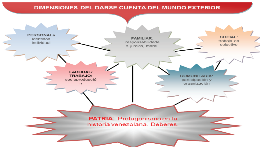
Diagrama 1: Dimensiones del Darse Cuenta del Mundo Exterior.

Valorando y reconociendo los saberes auténticos de nuestra gente, como originarios investigadores de sus comunidades, a continuación se hace una descripción (Ver Cuadro 1) decidida de las informaciones suministradas, con las dimensiones, también encontradas, del darse cuenta del mundo exterior o concientización, como se observa en el siguiente diagrama 1: