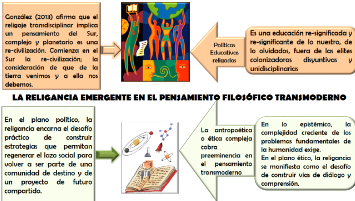
Figura 2. Realizada por la autora para la investigación 2019.