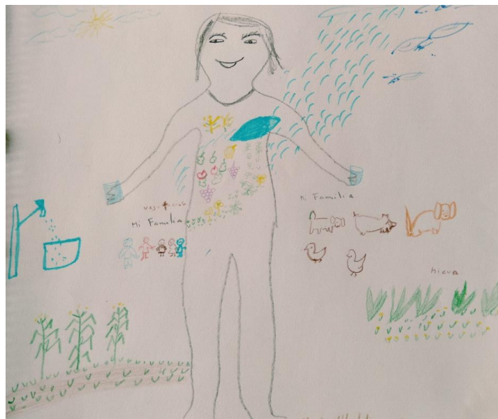
Figura 1. 6 Mapeo del territorio –cuerpo – agua. Encarnamiento del agua segura