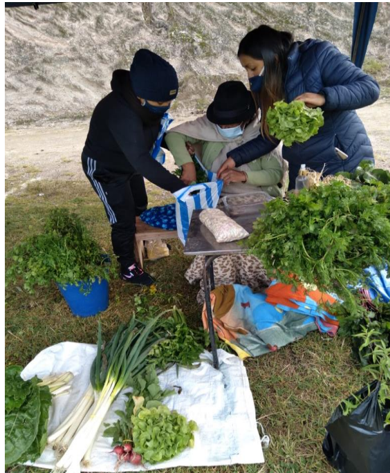
Figura 1. 3 Venta de productos producidos en la huerta

Estas prácticas, nos promete en lo tangible que es posible una vida digna pensada desde la economía feminista y campesina (Observatorio Social del Coronavirus 2020).