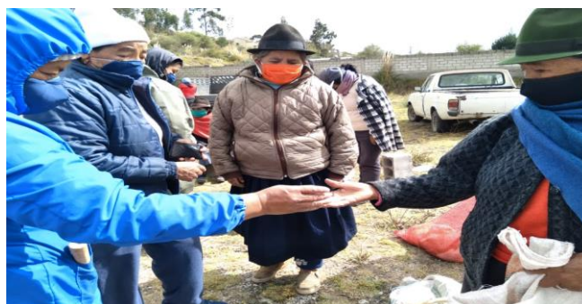
Figura 1. 4 Venta de animales menores

Los productos agrícolas ofertados en las ferias comunitarias son frescos, con apenas horas de haber sido cosechados, y al ser productos provenientes de las huertas, son limpios, sin químicos y seguros. Las mujeres de la comunidad hacen de la economía feminista el vehículo para poner en el centro de las actividades productivas y la reproducción de la vida. Situación que se intensificó en la emergencia sanitaria (Diario de campo, Santán Grande 23 de mayo 2020).