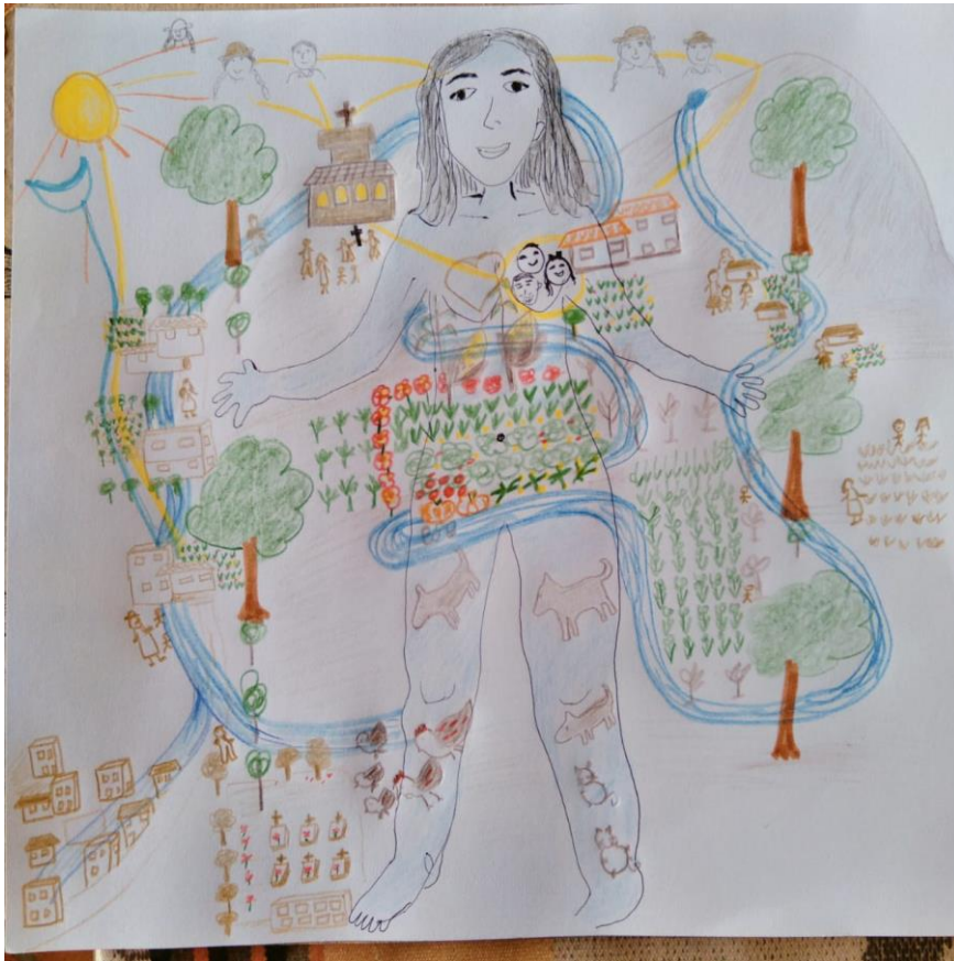
Figura 1. 5 Mapeo del territorio –cuerpo – agua: relación de inseparabilidad con el agua