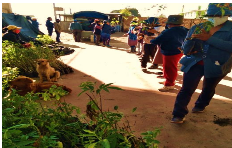
Figura 1. 8 Entrega de plantas para reforestar las vertientes de agua y cercas vivas al grupo de mujeres

Si bien, la entrega de plantas se la hizo a cada familia en la mayoría fueron las mujeres quienes se pusieron al frente de esta iniciativa. Ellas cumplieron con los requisitos y entrega de documentos necesarios, la preparación del terreno, el recibimiento del técnico del GAD para la inspección del sitio, el transporte de las plantas y la siembra de los árboles. Esto último lo realizaron con sus hijos, hijas, vecinas, hermanas y abuelas (Diario de Campo, Santán Grande 15 de octubre 2020).