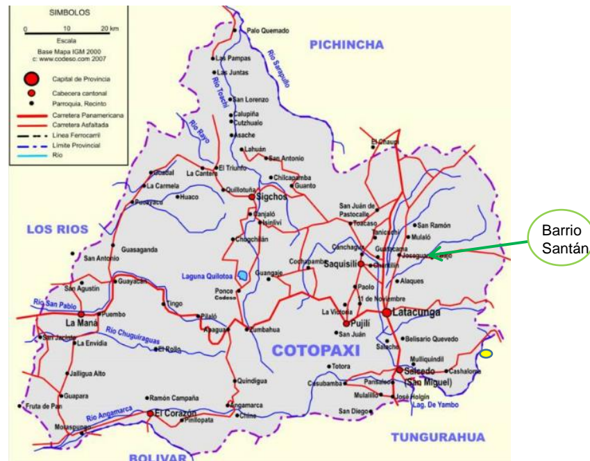
Figura 1. 1 Mapa de la provincia de Cotopaxi, ubicación del Barrio Santán