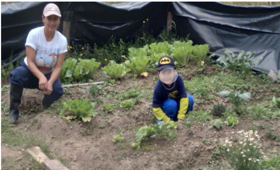
Figura 1. 2 Tareas formativas en el huerto

Las tareas de cuidados dentro de los hogares y en la comunidad cobraron importancia en la pandemia porque ayudaron a que los niños y niñas se adapten fácilmente a esta nueva realidad de intensificadas labores para el sostenimiento de la vida (Diario de campo, 5 de mayo 2020). Los niños y niñas a la vez que reciben cuidados son cuidadores y conscientes de su relación de inter y eco dependencia con los demás y con la naturaleza (Diario de campo, 5 de mayo 2020).