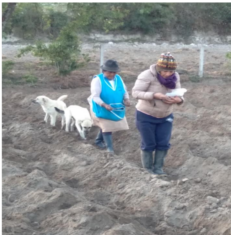
Figura 1. 9 Cooperación entre la vecindad para la siembra de granos andinos, acuerpando a la investigadora

Mi memoria ancestral aún conservaba parte de esta información que de niña mi abuela me enseñó. Sin embargo, esto lo saben las mujeres y la oralidad es su manera de transmitirnos los códigos de sobrevivencia en diálogo con la naturaleza (Diario de Campo, Santán Grande 25 de septiembre 2020).