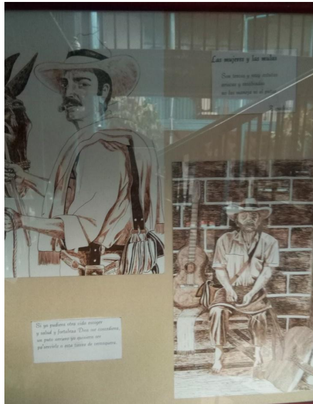
Fotografía 2. Arrieros. Fuente: Trabajo de campo 17-03-2020

trabajo campesino tan encantador que no hay razones para querer cambiarlo, tal cosa es casi una profanación de la cultura y la sociedad, frente a la fortuna de pertenecer a la nación antioqueña.