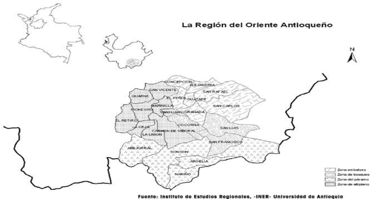
Mapa 1. La región del Oriente antioqueño